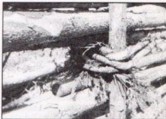
Gärdesgård med vidjor.

Förbundets ändamål enligt de första stadgarna.