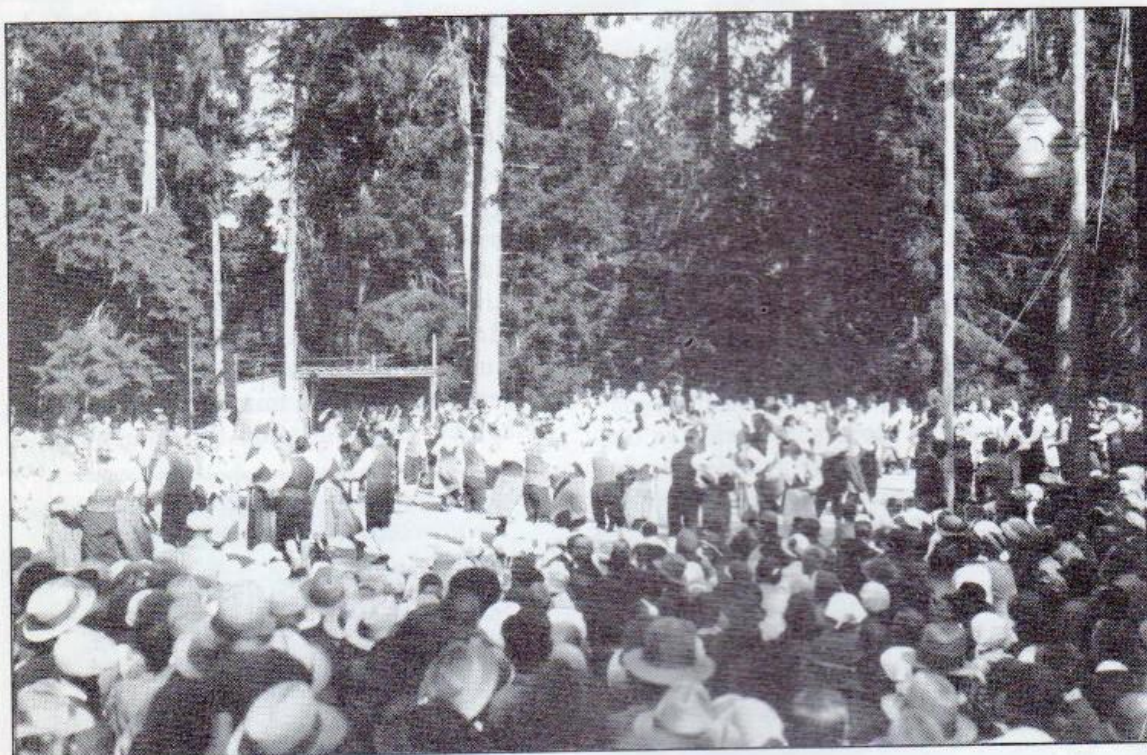
Publikbild från en av de sista hembygdstämmorna på Omberg.