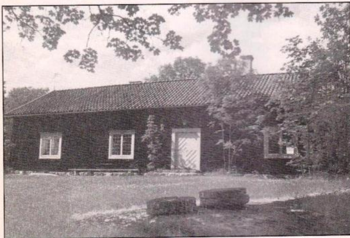
Hembygdsgården i Risinge.