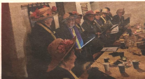
Östergarns kyrkokör sjunger vårsånger.

Ukrainaafton i Hönshuset på Rodarve Lördagen den 2 mars ordnade Östergarn Gammalgarns Hembygdsförening Ukrainaafton till förmån för Gammalsvenskby och Föreningen Svenskbyborna. En hjärtefråga för många som på olika sätt bidrog till insamlingen. Privatpersoner och företag skänkte fina priser till lotteriet, folk satte in pengar och många kom till festen. Ett stort tack till alla som