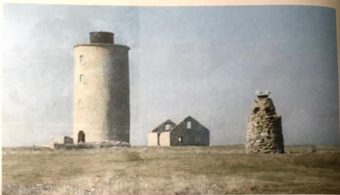
Fyren på Östergarnsholm. 2020 upptäcktes att inredningen var svårt angripen av aggressiv hussvamp. Nästa år ska saneringen vara klar.