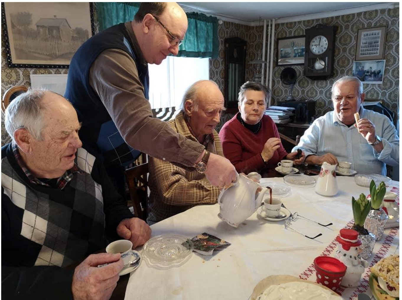
Gissa när det dracks en oskaplig massa kaffe och mumsades oräkneliga kakor, bullar och tårtor...