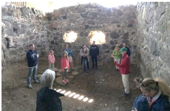
Besök i ruinen Biskopstuna.