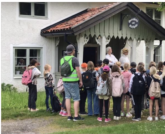
Klassen lyssnar till fröknarnas förmaningar.

De fick sedan gå upp i skolsalen och provsitta de gamla ryggstödslösa bänkarna. De fick också veta att när det var kallt på vintern fick en av eleverna i uppgift att komma extra tidigt till skolan och tända i kaminen i skolsalen för att det skulle bli lite varmt tills barnen och fröken kom.