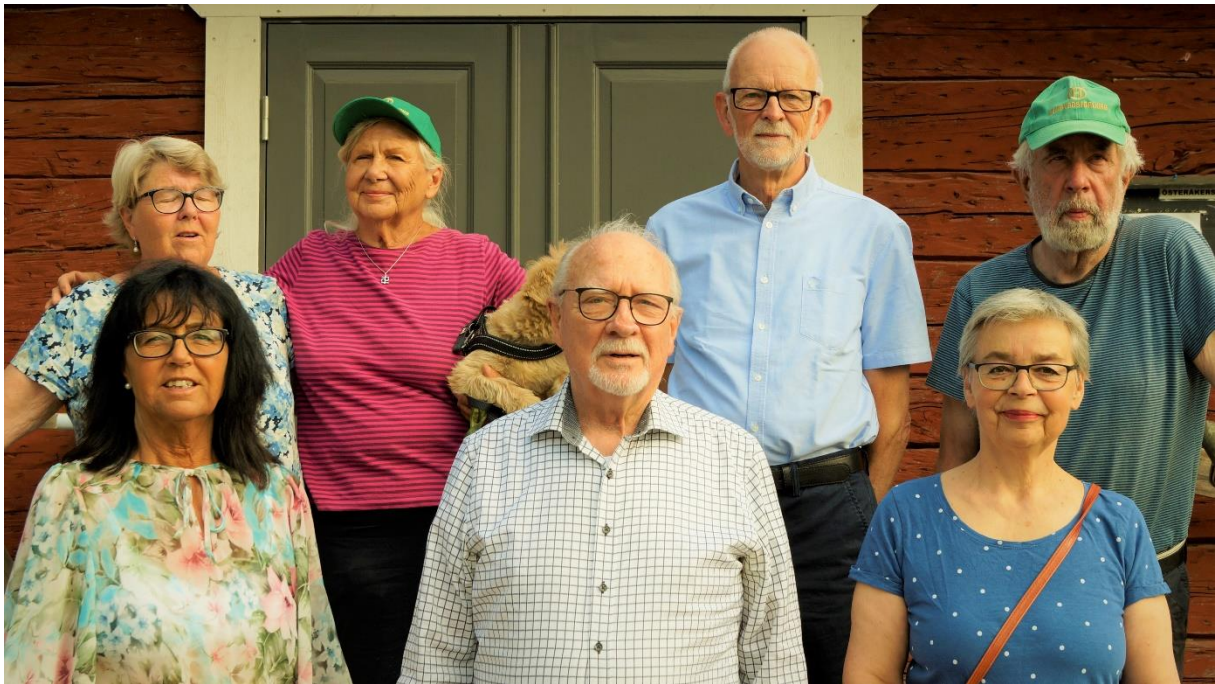
ÖHF:s styrelse

facebook.com/osterakershembygdsforening/