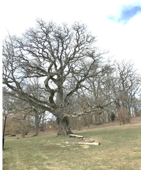
Majestätisk ek i Ekbacken

Centralvägen 55 184 32 ÅKERSBERGA Telefon (svarare): 08-540 67980 Plusgirokonto 9814-5 Bankgiro 5632-8511 mail@milstolpen.org Hemsida: www.milstolpen.org eller www.hembygd.se/osteraker facebook.com/osterakershembygdsforening/