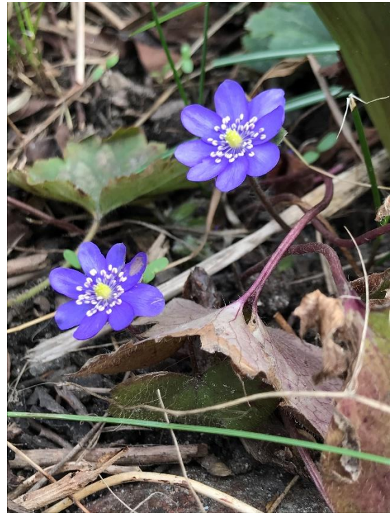
Blyga blåsippor på Vallmovägen