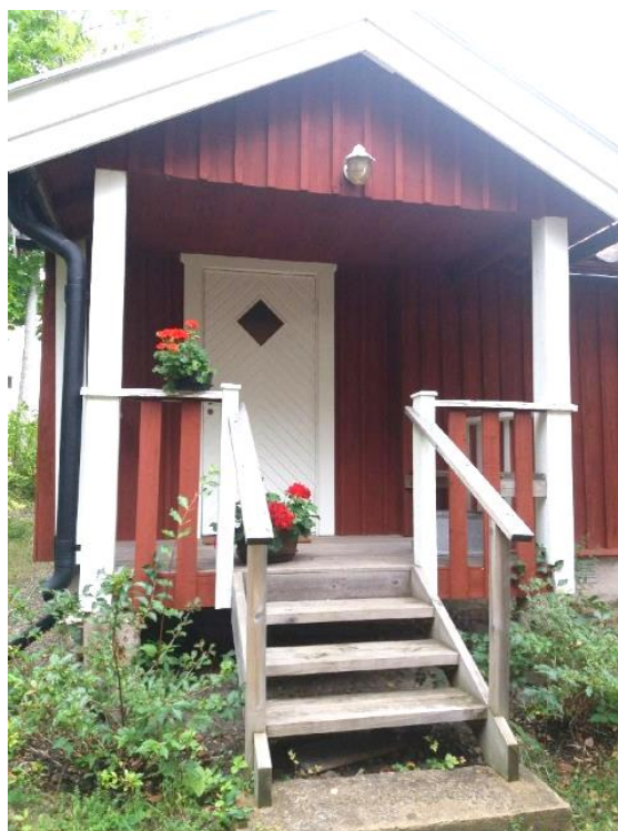
Tant Klaras stuga

Trots allt händer det i det tysta saker, t.ex. trädgården runt hembygdsmuseet och tant Klaras stuga är ompysslad och blomstrar i ordets rätta bemärkelse.