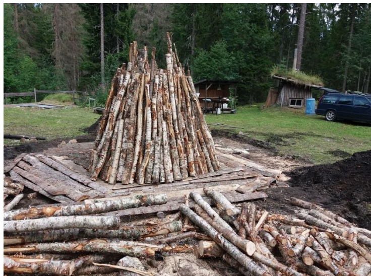
Kolmila