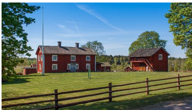
Hembygdsgården i Lerbäck.

Vi har beställt vackert väder och trevlig underhållning – välkomna.