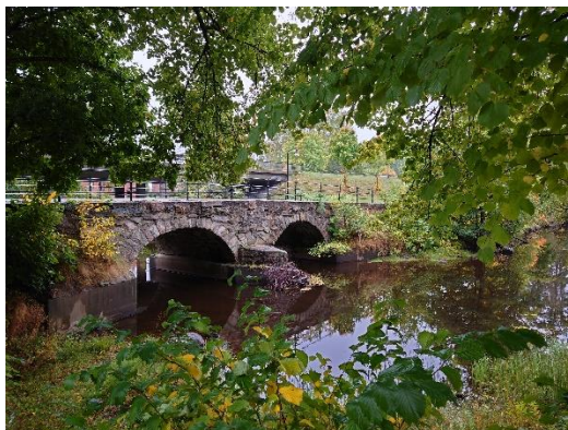
Bro vid Kvarteret Bryggeriet Nora.

Avsätt datumet i era kalendrar redan nu! Inbjudan kommer senare i höst.