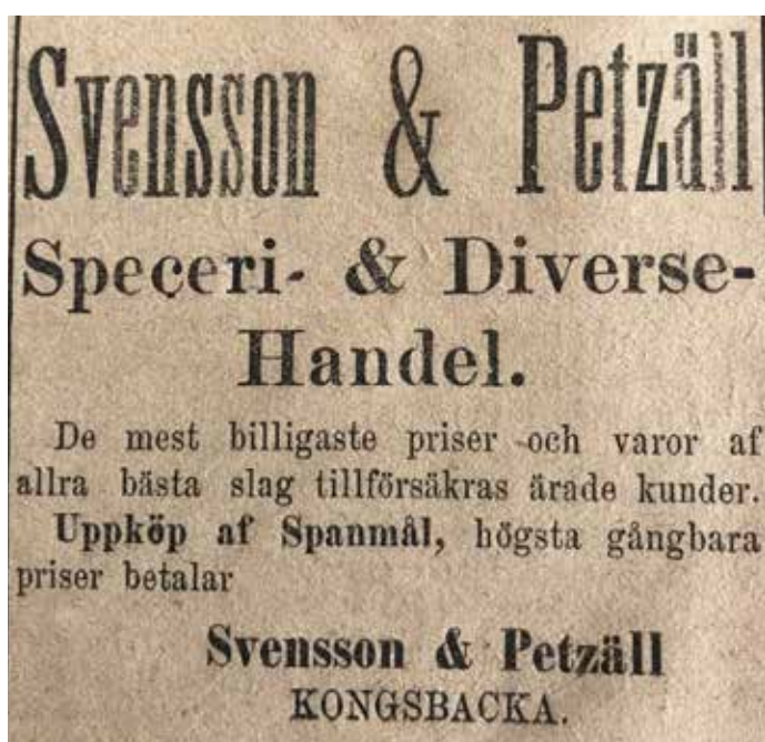
Annons i tidningen Kongsbacka Allahanda 1879.

Onsala hembygdsgille är en del av Nordhallands Hembygdsförening www.hembygd.se/onsala-hembygdsgille