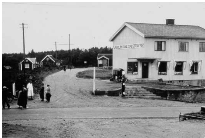
Den första affären vid Vickan var Furugläntan.