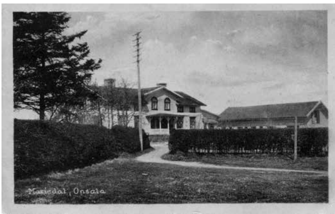
Onsala Handelsbolag AB på Mariedalsgård.

Affärerna kunde inte sälja fisk på grund av brist på kylmöjligheter. Däremot sålde lokala fiskare fisk och skaldjur som de själva fångat. På 40-talet sattes det på flera ställen bottengarn i fjorden. Dessa gav stora fångster av bland annat torsk och laxöring som också kunde levereras till Göteborg.