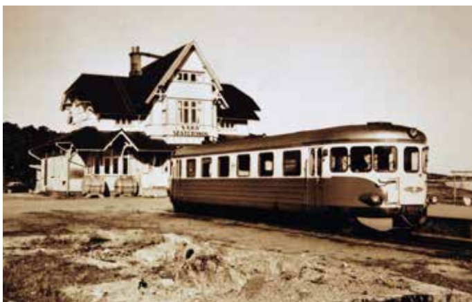
Det var en önskan om en järnväg härifrån Säröstation till Onsala i början av 1900-talet.