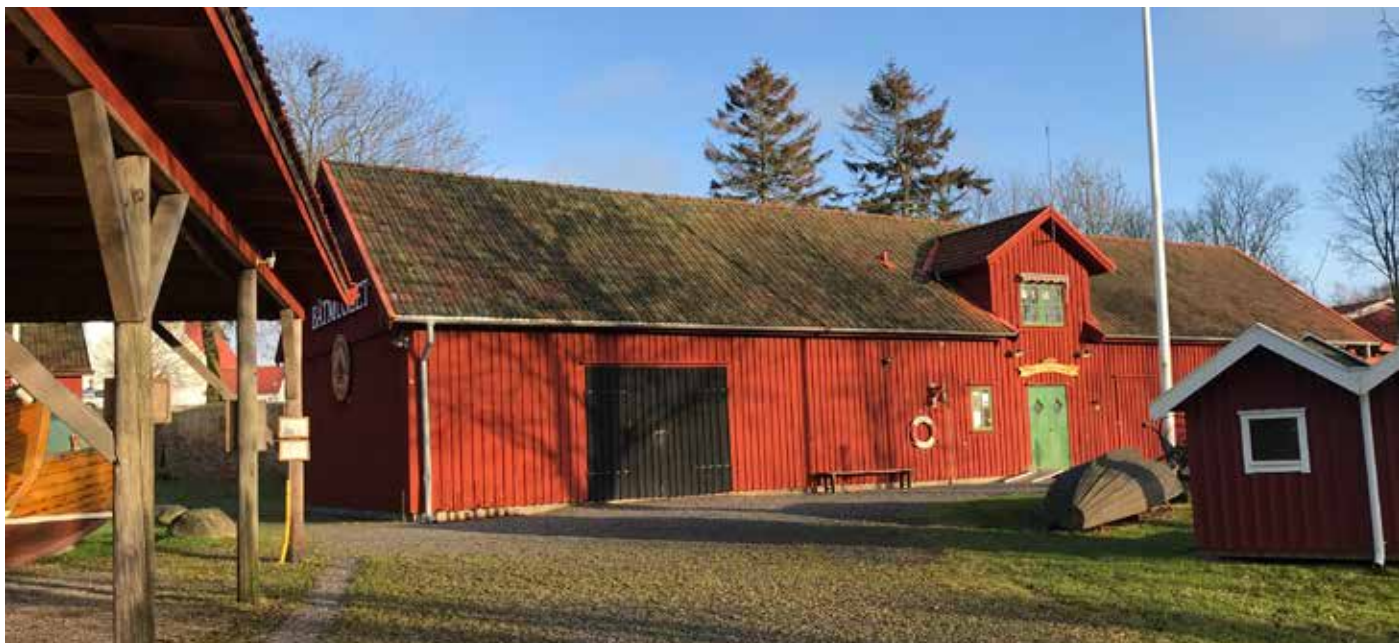
Båt- och Sjöfartsmuseet i Onsala.