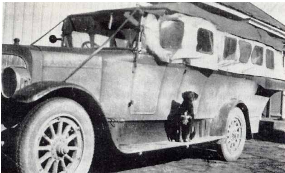
Långa Louisa.