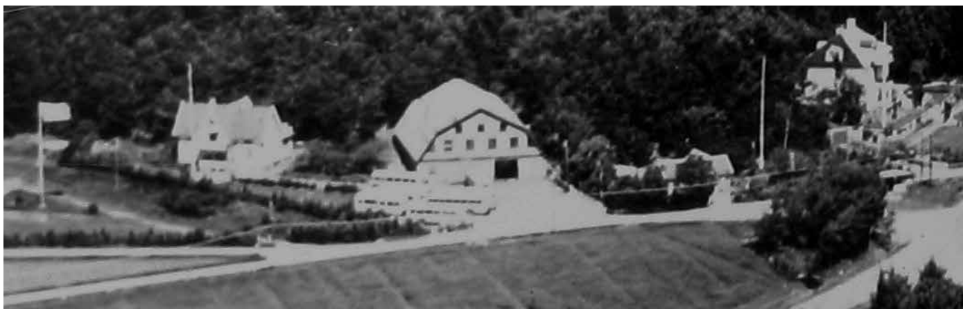
Mitt i bilden ser man tydligt Lindgrens bussgarage