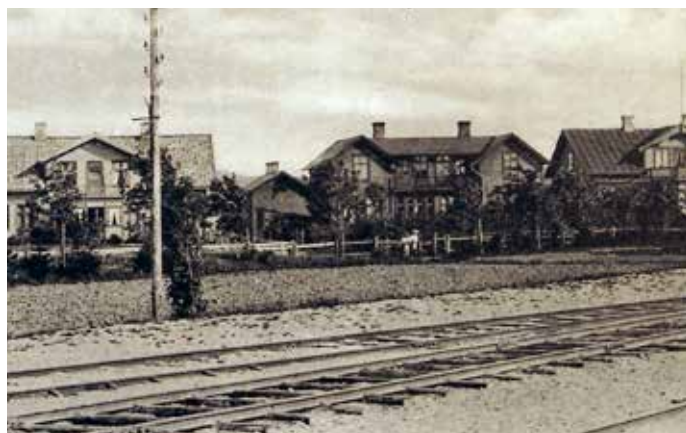
Järnvägen i Kungsbacka 1902.