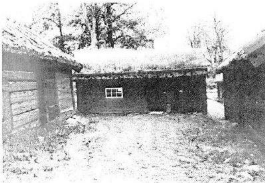
Fridhem med den gemensamma man-och fägården

Husen i sig är små och låga. Det grova timret skjuter ut i hornknutar och taken är lagda med vass eller torv. Fasaderna saknar i huvudsak brädfodring. Endast vissa delar av ladugården samt det yngre boningshuset har klätts med panel.