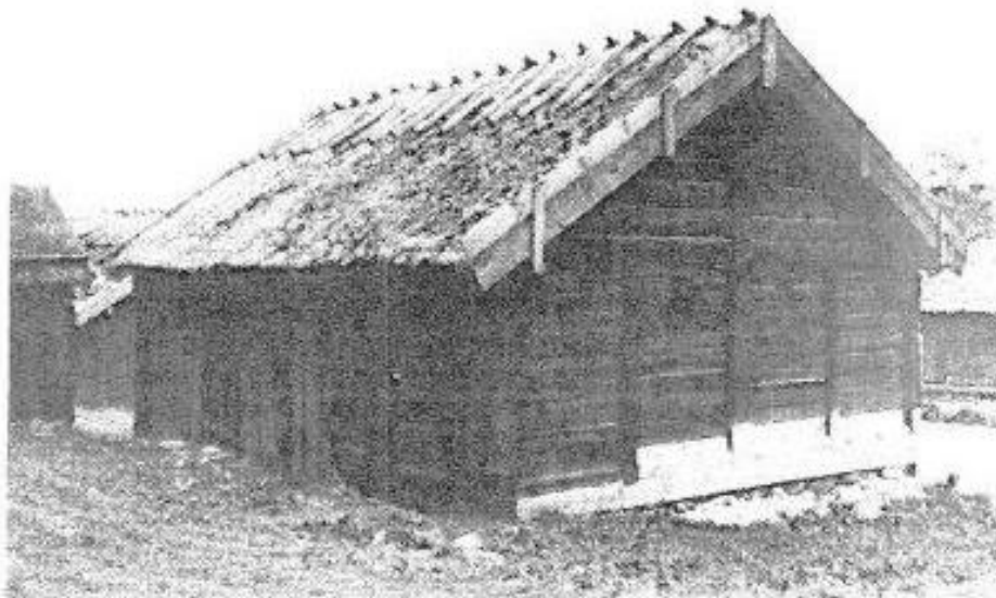
Mesula vid norra ladugårdens norra gavel.

Svinhuset har en synlig mesula upp tillnocken vid sin södra gavel medan den bredare norra ladugården har en mer komplex konstruktion. Här flankeras mesulan av två kortare ytterstolpar som bär väggbandet.