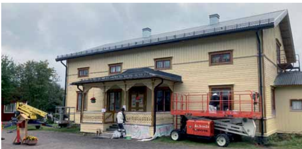
Projektet ommålning av vår gamla prästgård som byggdes 1891, har varit igång sedan några år tillbaka. Nu är linoljefärgen på plats.

Något om en helårsöppen hembygdsgård med 3 personer deltidsanställda.