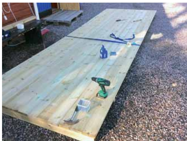
En modul till den mobila dansbanan klar.