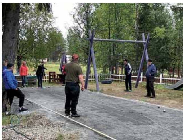
Boulebanan välbesökt under sommaren.