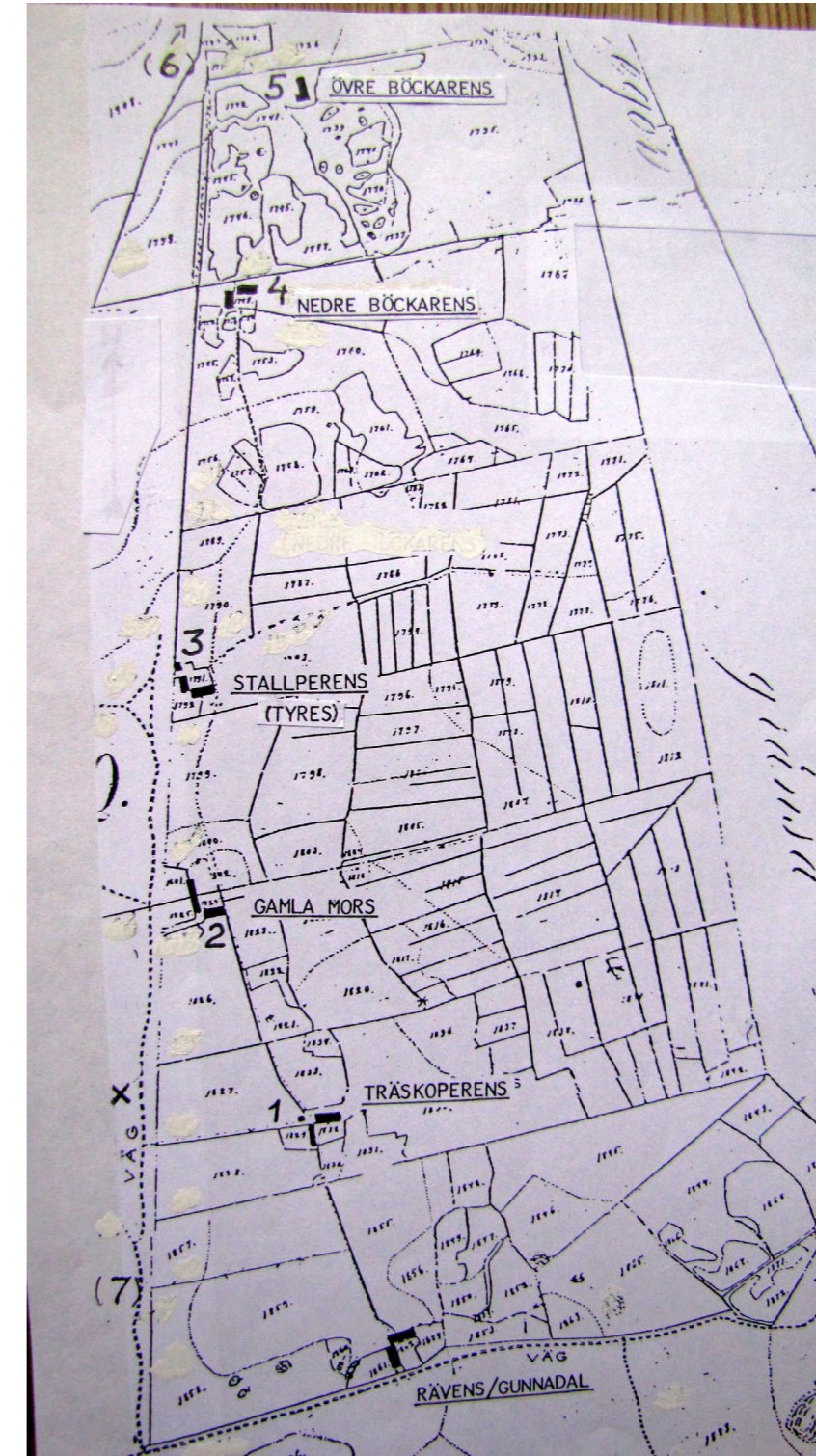
Utdrag ur karta över Strö Västreskog 1879. Original i Lantmäteriets arkiv. Torpens namn reviderade 2012 efter nya uppgifter.

eller någonting annat – likheten med en backstuga finns – så har det inte lyckats att få någon förklaring på vad den tjänat för ändamål, eller när den tillkommit. Det finns mera att utröna om bebyggelse i Västreskog.