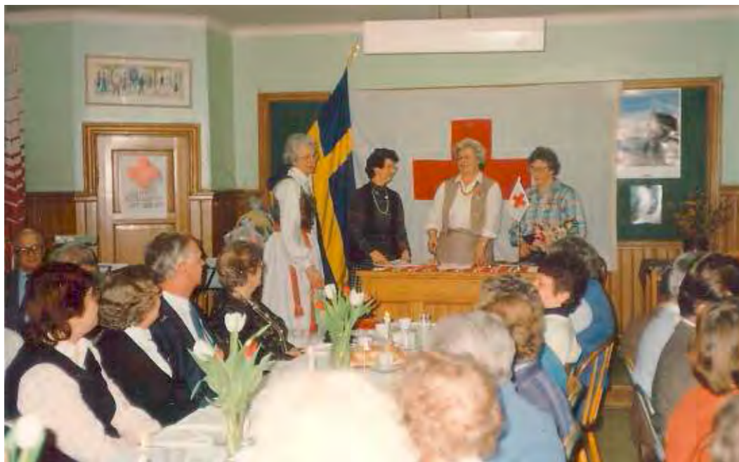
Norra Strö Röda Kors krets firar 50-års jubileum 1987.

Jag är glad att jag tog mig an uppgiften att skriva ner lite om Röda Korsets viktiga arbete i Strö under många besvärliga år. I tider när man med rätta ibland måste ifrågasätta var våra insamlade medel hamnar känns det extra angeläget att veta hur mycket det ideella arbetet har betytt och betyder. Då fanns behoven i det egna närsamhället. Jag håller inte för otroligt att den samhörighetskänsla som fortfarande finns i vår by delvis grundades då.