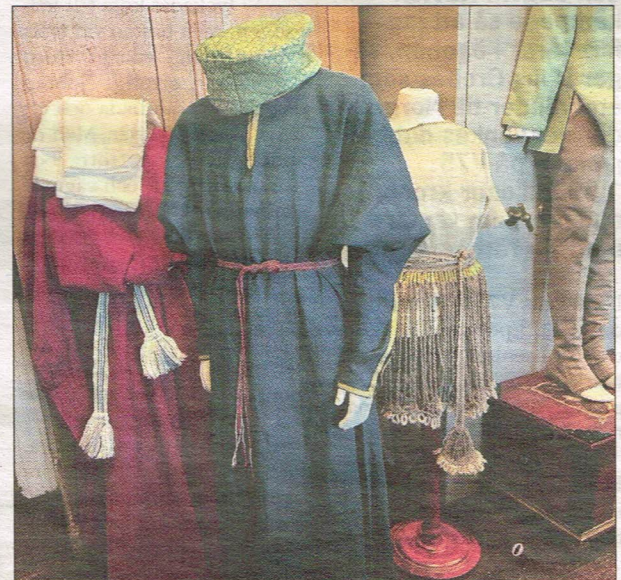
Genom att studera skulpturer i kyrkorna runt om i Munkedal har man lyckats återskapa kläder som användes för flera hundra år sedan.