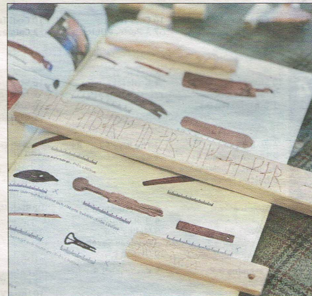
Det följer med en bok till varje skattkista, där man kan fördjupa sig om föremålen som finns i skattkistorna.