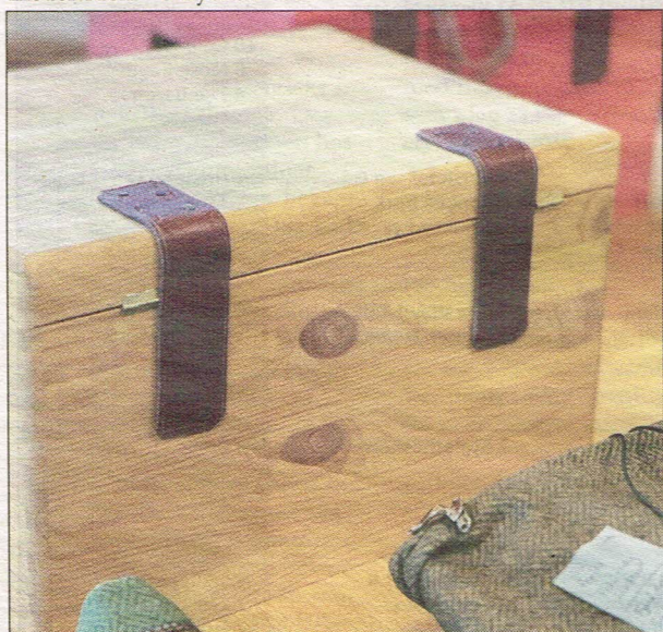
I pilotprojektet har man snickrat ihop skattkistor som ska förvara undervisningsmaterialet som baseras på lokala fynd från exempelvis medeltiden.