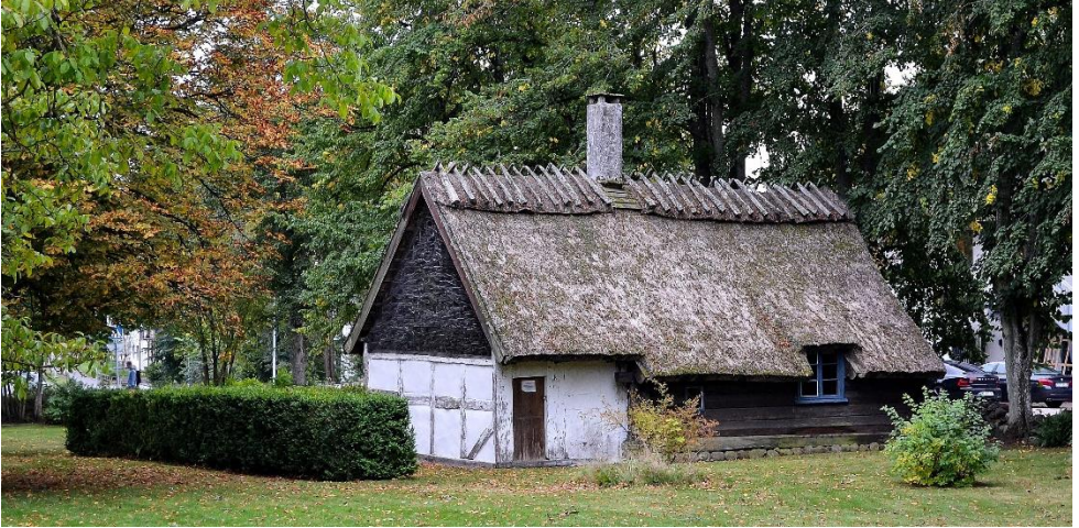
Ryggåsstugan, fotograferad tio dagar efter jubileet, den 26/9 2021.