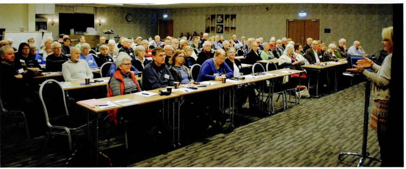
Ångermanlands hembygdsförbunds årsmöte på Hallstaberget.