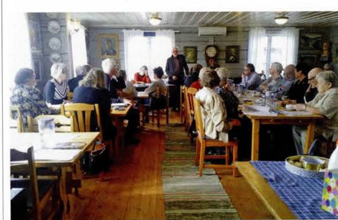
Medelpads Hembygdsförbund. Årsmötet i Njurunda hembygdsgård.