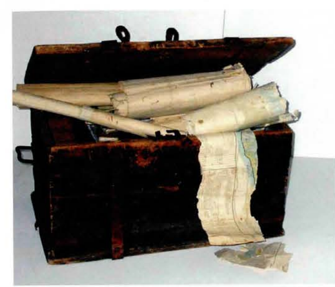
Bykista som tillhör Ensillre byalag i Borgsjö (Y). Den har visats upp bl.a. på hembygdsförbundets riksstämma i Umeå som riksbykis-