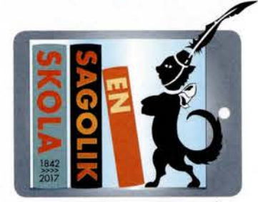
FOLKSKOLAN 175 ÅR

Verksamheten vid Hallsta skola pågick fram till hösten 1999. Då lades skolan ner och barnen bussades därefter till skolan i Ånge.