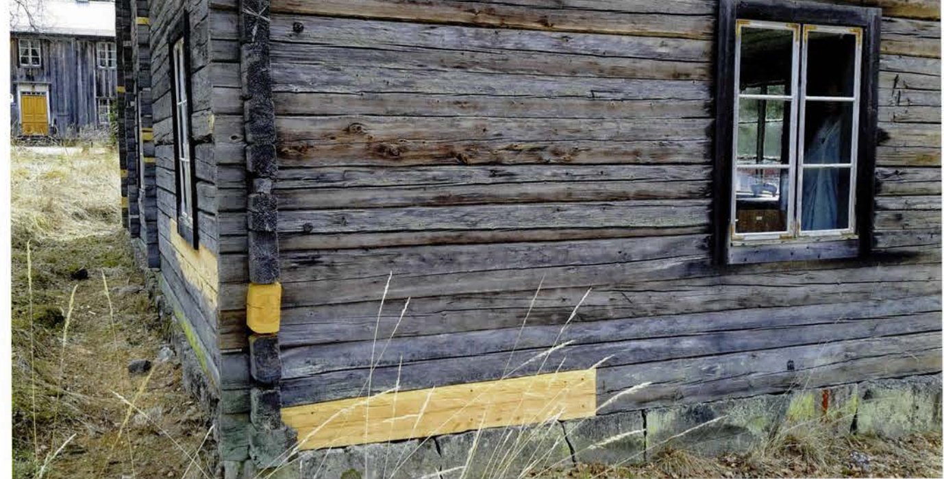
Reparation på hembygdsgården i Borgsjö.

råde som kallas Rekreation och Turism, inom landsbygdsprogrammet skulle vi kunna (de båda förbunden, enskilda föreningar, berörda kommuner och eventuellt länsmuseet) formera ett projekt för lokala besöksmål och göra något större. Ett sådant projekt skulle kunna inkludera såväl hembygdsgårdar som lokala kulturmiljöer det vill säga pärlor och besöksmål som ligger bortom de stora allfartsvägarna. Ofta är det unika platser med stora kvaliteter, just sådana platser som många, särskilt utländska turister, gärna vill se. I det kan vi väva in de platser som länsmuseet och hembygdsföreningar, separata projekt (Pilgrimsleden och ISKA), länsstyrelsen m fl har skyltat gemensamt inom skyltprojektet "Den stora utställningen i landskapet.