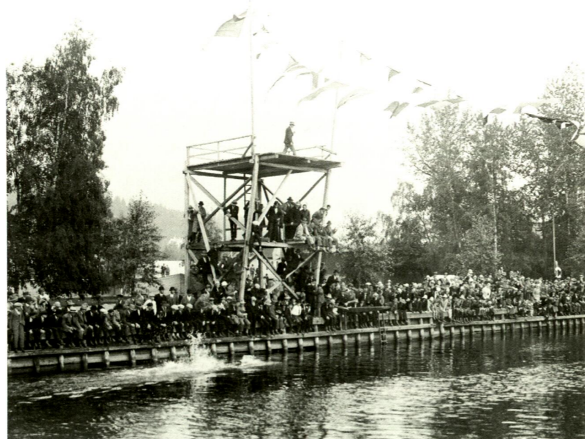
Uppvisning i Selångersån 1925.

1956 står Timrås nya badhus klart med en 25-meters bassäng. Läget i Sundsvalls Simsällskap är dystert, men 60-talet visar sig bli föreningens mest framgångsrika period dittills. På tio år erövrar klubbens simmare 85 SM-medaljer och slår flera