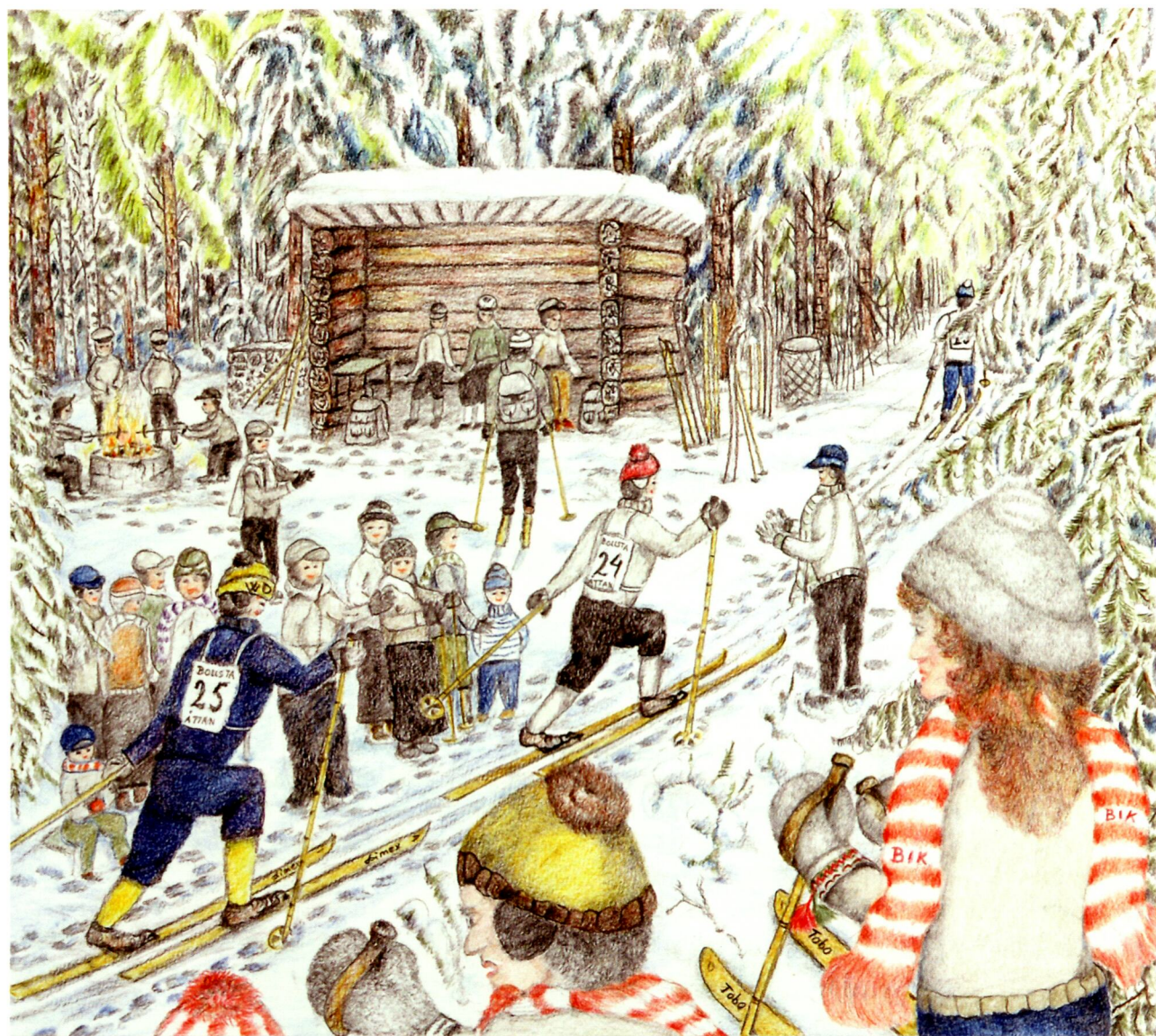
Röåsen, skidtävling i Bollstabruk. Akvarell av Leif Hiller.