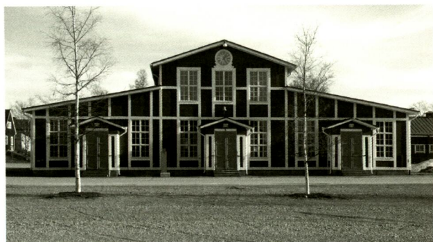
Mässen på f.d. I 21.

Det dagliga harvandet mellan 8 och 17 fyllde en otränad yngling med behaglig trötthet som avskärade från det hittillsvarande livet och försänkte honom i behaglig likgiltighet för allt annat än nutiden runt kaserngården. När tapto blåsts skulle det vara tyst på luckan, risken för dagofficerens uppdykande fanns där alltid. Men det var inte svårt att äntra järnsängarnas första eller andra våning och sjunka ned på knöliga halmmadrasser vi stoppat vid inryckningen. Insvept av doften från fjolårets hö- och klöverängar föll sömnen över en likt ett mjukt överkast. Snart var logementet fyllt av sexton mans pustanden och snarkningar i den totala trötthetens drömlösa sömn.