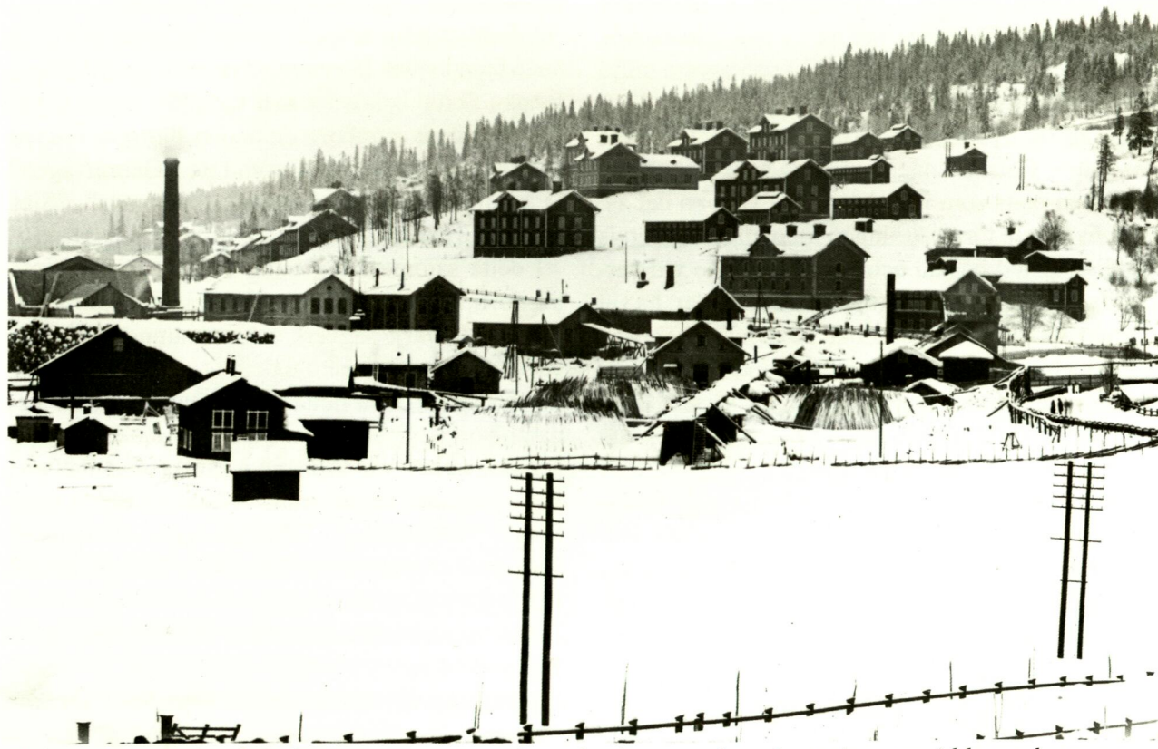
Skönvik i vinterskrud. I slutningen ner mot sågverket ligger arbetarbostäder utspridda med namn som "Tivoli", "Rullan", "Vasa", "Saraborg".