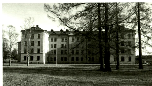
Kasern på f.d. I 21.