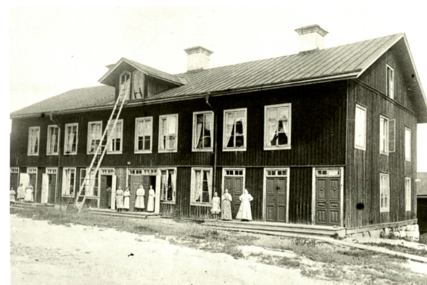
Alla arbetarkaserner vid sågverken gavs mer eller mindre fantasifulla namn. Bilden visar "Långbyggnaden" vid Östrandens sågverk.

Vanligast var att man helt enkelt använde benäm-