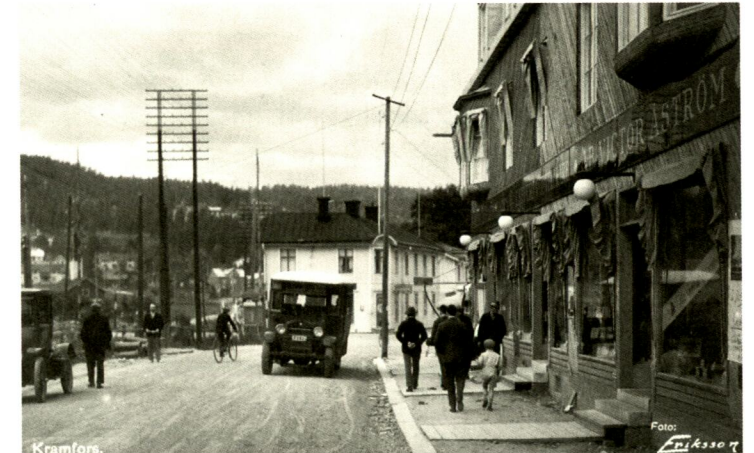
Stationsgatan i Kramfors i början av förra seklet. T.h. syns Åströms bokhandel salig i åminnelse. Bilder i Ådalen.