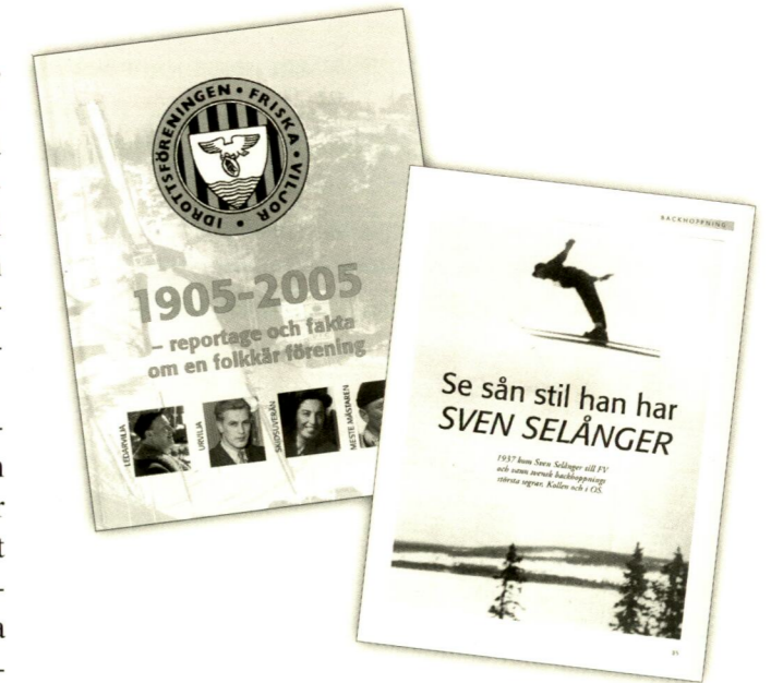
Friska Viljor utgav 2005 en bok till sitt 100-årsjubileum Idrottsföreningen Friska Viljor 1905-2005 – reportage och fakta om en folkkär förening .

Var och en av dessa föreningar är en egen juridisk person med egen styrelse. Men man har ett gott samarbete med varandra. Utvecklingen inom