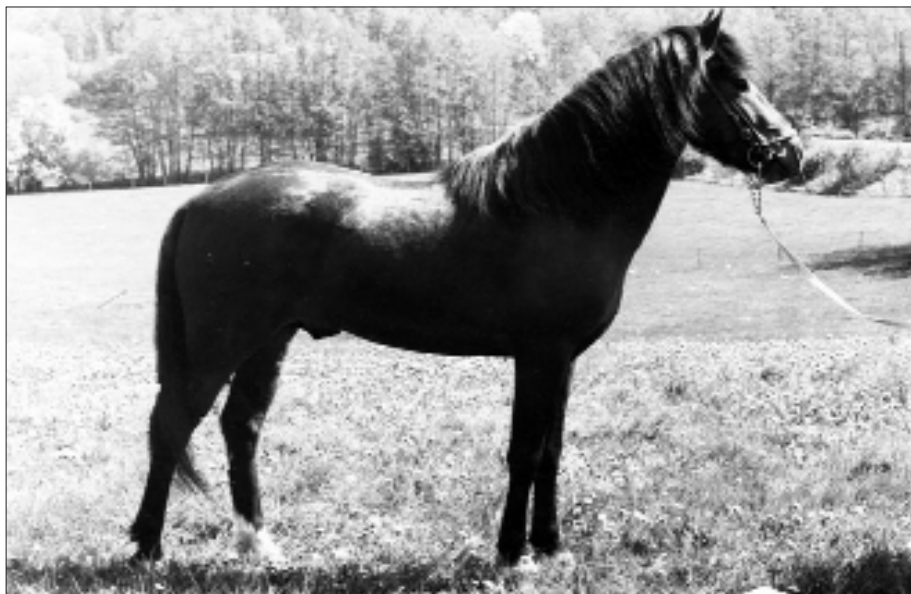
Hedlanda Meteor född 1967, död 1988. 21 år.

Efter arrendeperiodens upphörande började vi en tid av intensivt arbete med avelsuppfödning av biffkor av Hereforsrasen, New Forest ponnyuppfödning och uppfödning av Leicesterfår. Det var en för mig, som stor djurvän, givande tid. Jag njöt av att vistas i ladugård, stallar och fårhus. Det var underbart att se frigående djur på betesmarkerna. Vår fårflock hamnade en gång på järnvägsrälsen mellan Läggesta och Taxinge. Dramatik! Jag fick ringa SJ och polisen, så att de kunde stoppa tåget. Därefter kände vi att det var bäst att sluta med fåraveln.