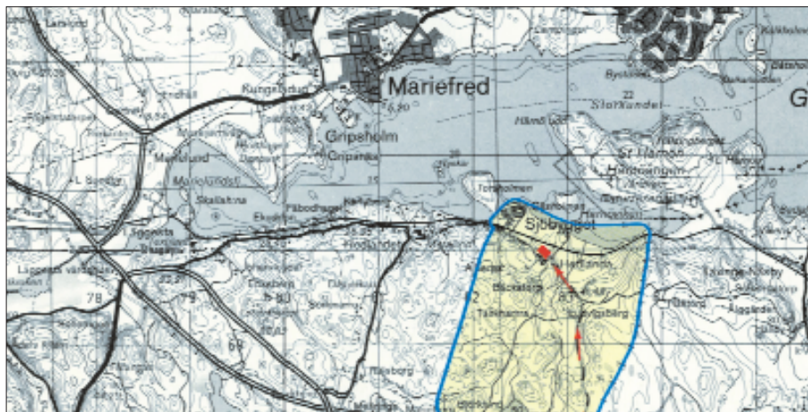
Hedlanda gårds placering vid röd markering.