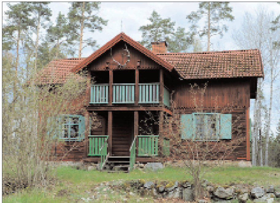
Jaktstugan på Hedlanda gårds ägor.

Särskilt roligt var det framgångsrika avelsarbetet med den lugna Herefordrasen. Vi fick studiebesök från Texas och Nya Zeeland och fick mycket beröm. Vi ställde ut tjurar på riksutställningar. Våra New Forest ponnyer hade också stor framgång på riksutställningar. En av våra döttrar var intresserad av ridning och hade framgång i dressyr och hoppning med våra egna New Forest. Alla i vår stora familj var djupt engagerade i gårdens och djurens skötsel. Arbetet med djur är oändligt berikande! Våra söner trivdes även med att driva skogsbruk.