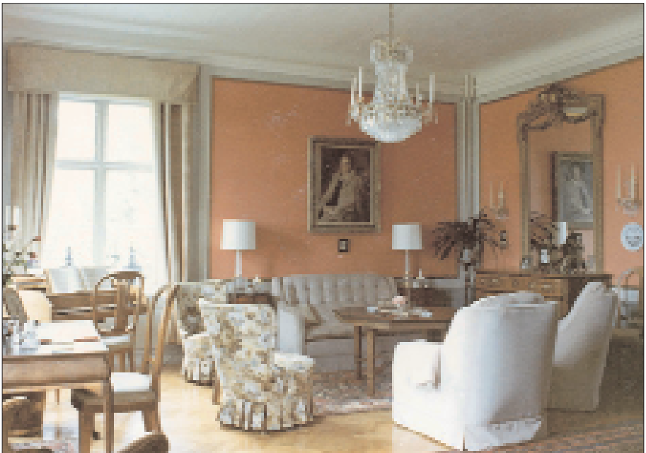
Hedlanda gård, interiör från salongen. 1970-tal.