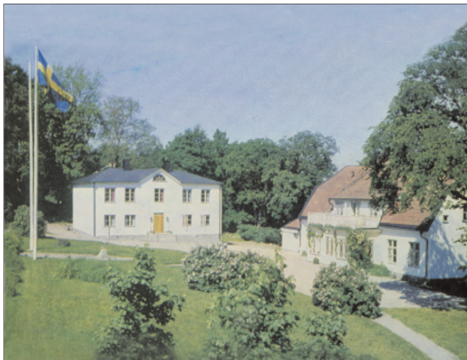
Hedlanda gård.

Marens tankar och fakta från ett liv på landet nära Mälaren, närmare bestämt på Hedlanda.