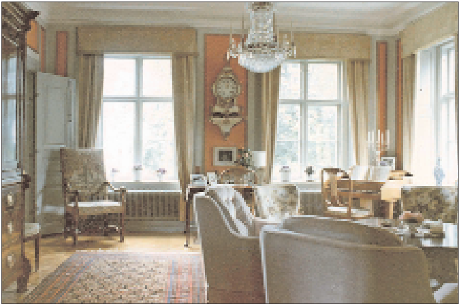
Hedlanda gård, interiör från salongen. 1970-tal.