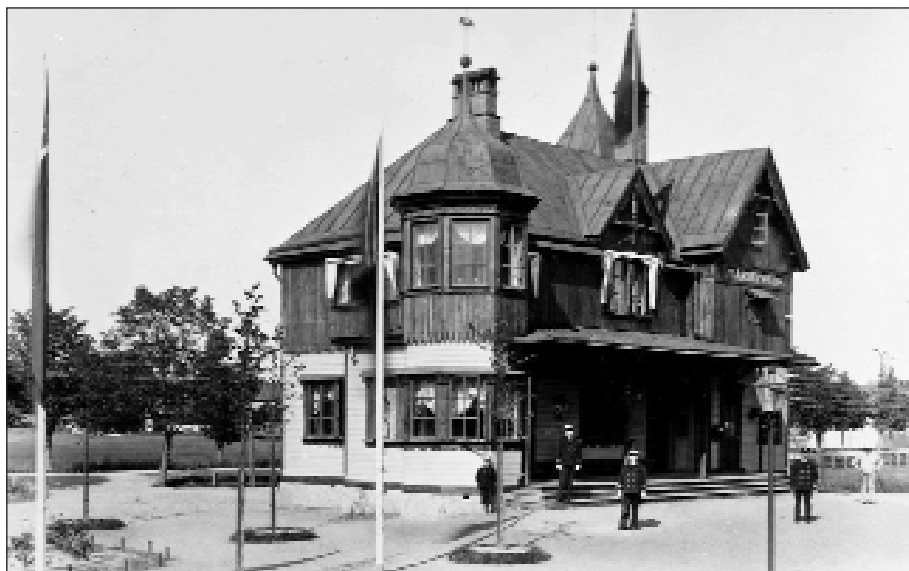
Mariefreds Järnvägsstation byggd 1895. Foto: Okänd 1897.