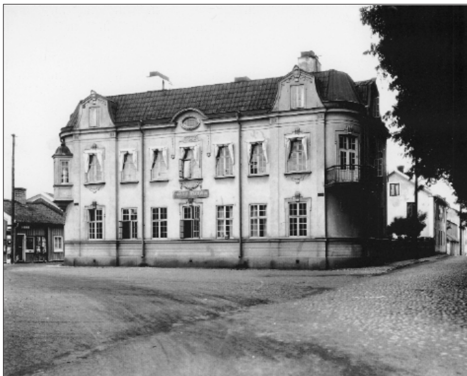
Jugendhuset i Mariefred. Foto: Lindmarks 1930-talet.

Rahmqvist var mycket uppskattad och fick många byggnadsuppdrag. Som exempel kan nämnas Jugendhuset, Järnvägsstationen och Villa Martin (Gripsnäs) i Mariefred. Vidare Stureskolan (folkskola), och gamla Systemet i Strängnäs, samt ett flertal renoveringsarbeten på Gripsholms slott, Mariefreds kyrka, Åkers kyrka och Domkyrkan i Strängnäs.