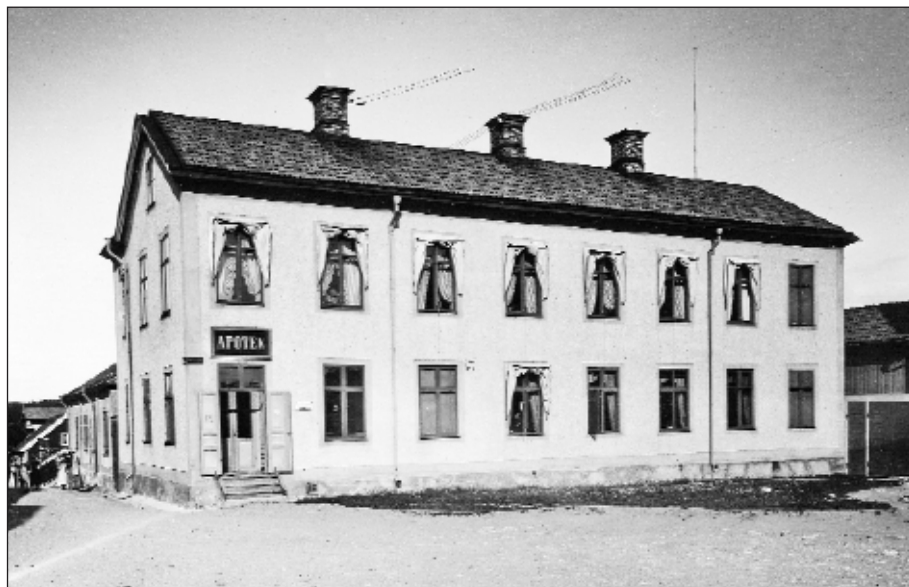
Kungshustorget omkring 1900. Hus och Apotek från 1893.