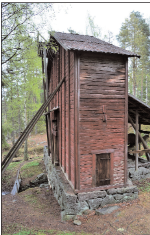
Hjulhuset vid Göksjön i Åkers bergslag