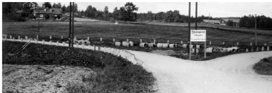
Mariefredsvägen. (Gamla vägen före villabygget vid Trekanten). Till vänster vägen mot Gertre och närmast till höger mot Fridhäll. Årtal: Troligen före 1930.