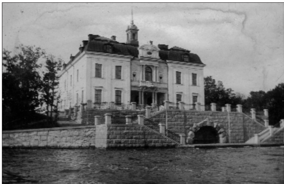
Villa Martin senare Gripsnäs. 1903.