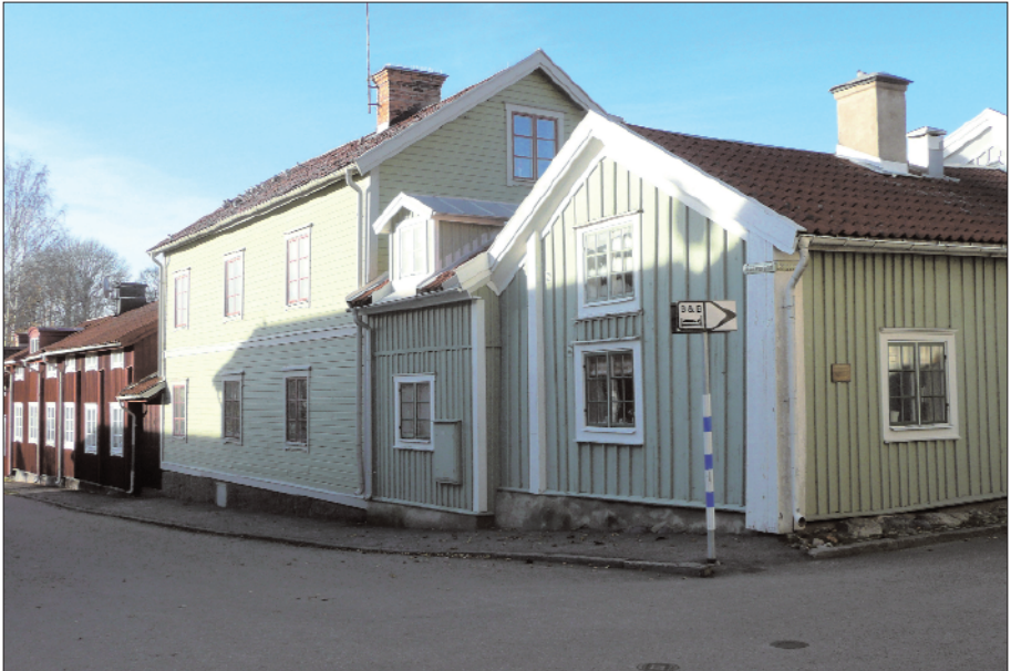
Storgatan 2. (Gård nr 60 eller Setterholmska gården).