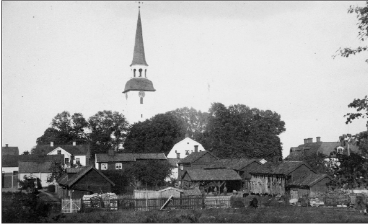
Söderströmska garvaregården No. 11.

Foto: Okänd. Årtal: Okänt. Donation av Ingeborg Sjöstrand, Stockholm, 1955.