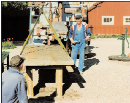
Uppsättning på Callanderska.