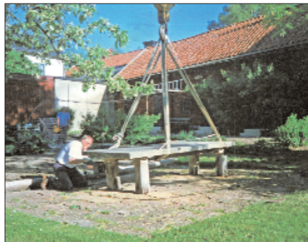
Nedmontering på Gård 60.

Som kuriosa kan nämnas att på gården stod ett stort kalkstensbord. Bordsskivan som väger över ett ton flyttades med lyftkran från Setterholmska gården till Calladerska gården på 1990-talet. I dag är bordet ett uppskattat inslag utanför hembygdsmuseet.