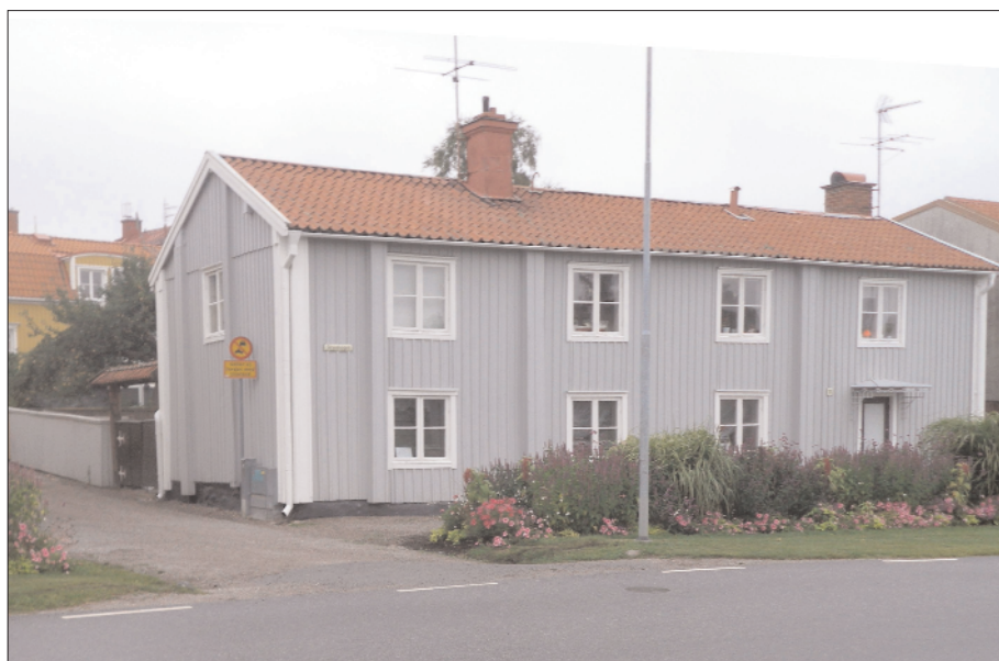
Garvaregränd 4. (Gård 83, Garvaregården).