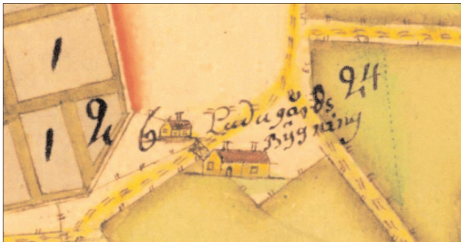
1723 års karta visar dels en större herremansbyggnad söder om vägen och en mindre norr om den.