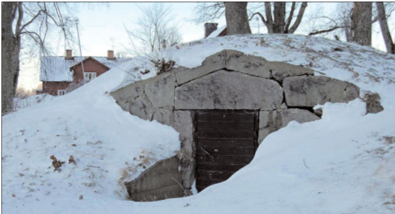
Ingången till den gamla potatiskällaren. Ingen närmare åldersanalys verkar ha gjorts av denna källare som idag står tom och övergiven på Midsommarängen.

Hela dagens Lottenlund och Munkhagsgårde var en enda stor vik från Gripsholmsfjärden. Att snabbt ro över familjen till borgen från klosterudden är lika orealistisk. Fienden kunde ju mycket väl komma från vattnet. Det kunde storma. Nej, inte sannolikt. Troligare är alltså istället att Sten Sture låter bygga sitt hus på den höjd där idag den så kallade gamla potatiskällaren fortfarande lig-