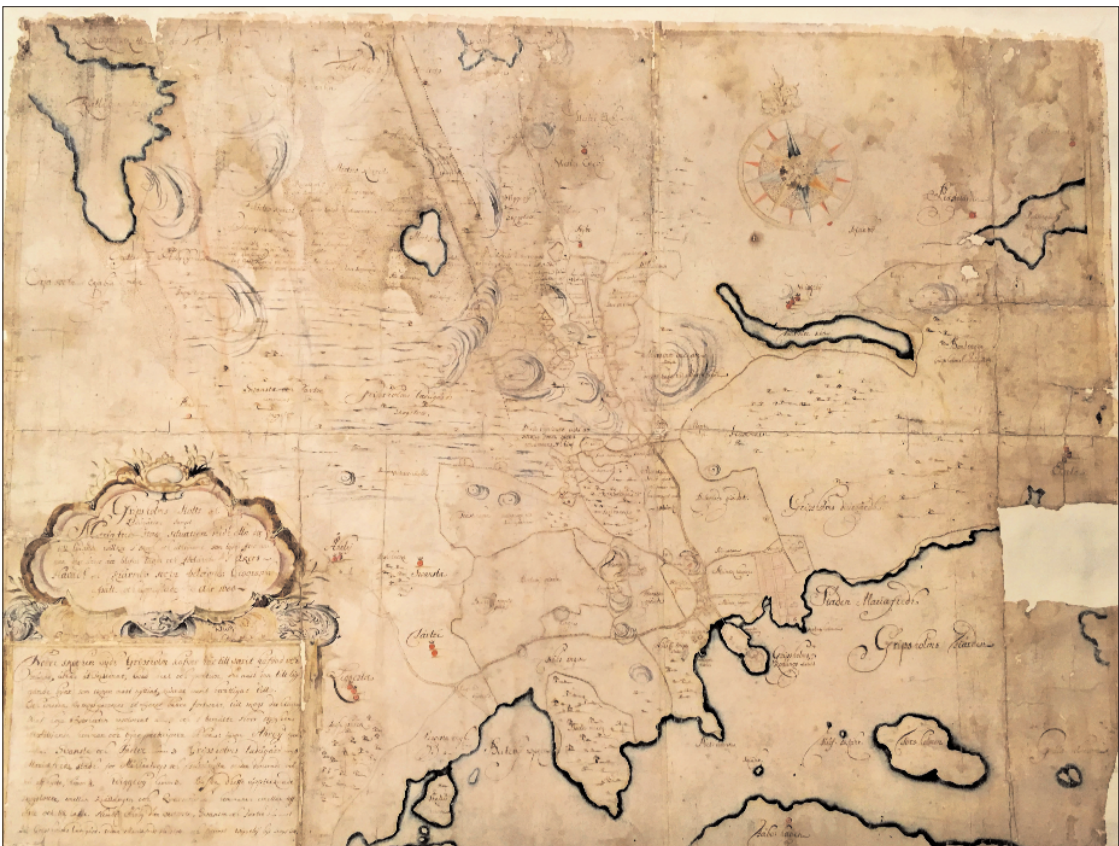
1688 års karta.