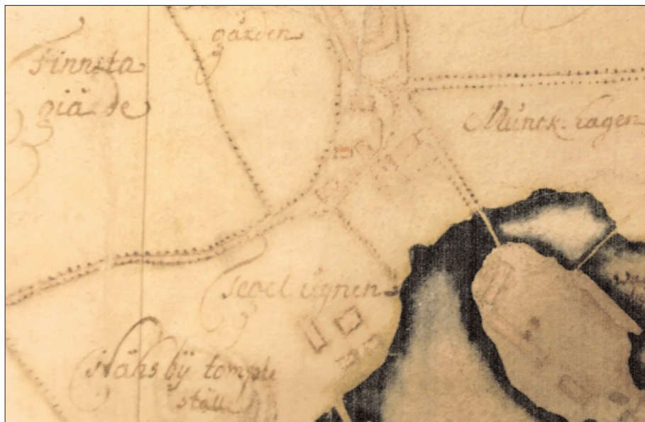
1688 års karta visar till vänster i nedre hörnet »Närsby tompställe«. Där redovisas inga befintliga byggnader. Däremot visas såväl den fyrlängade ladugårdsbyggnaden som den senare mangårdsbyggnadens västra flygel, vad som kan vara hela eller del av Gammalgården och det som måste vara den stora gästgivarbyggnaden söder om vägen som uppfördes 1592.

Sture uppförde en ny stenbyggnad för sig, som senare kom att kallas »Gammalgården«. 1491 donerade han dock denna Gammalgård plus en del mark till Kartusianerorden för att dessa munkar skulle kunna bedriva sin verksamhet i Sverige. Denna orden var då inte överhuvudtaget etablerad i Sverige. Den mark som medföljde var troligen dels den mark som Gammalgården stod på och dels den halvö på vilken klostret senare kom att anläggas. Klostret kunde invigas 1493 som nordens första och