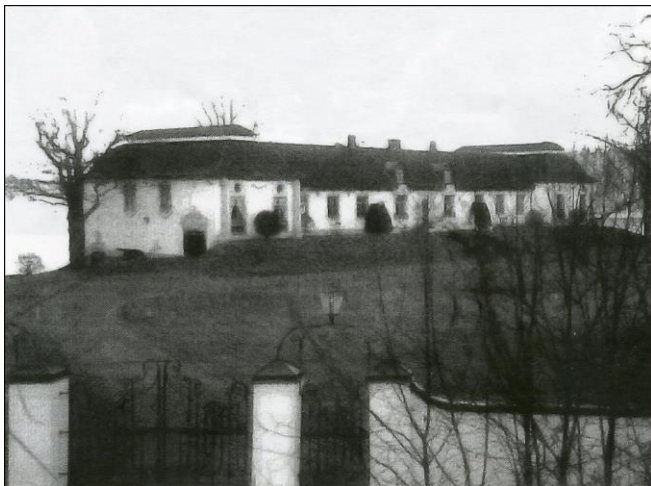
Åsgård efter ombyggnaden i mitten av 1960-talet

Av Eskilstuna stad belönades han 1964 med statyetten "Hamra på" av Bejemark. Samma år fick han Boklotteriets stipendium på 1 000 kr för sin kulturella verksamhet.