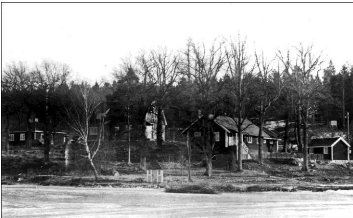
Åsgård med flyglar, från sjösidan omkr. 1950

Genom hans dåvarande frus försorg tillkom Åsgårds skolhem. Man vände sig främst till bättre bemedlade familjer. Barnen i skolåldern lär ha gått i Lotorps skola. Enligt utsago skall han dock fått upphöra med verksamheten efter en inspektion.