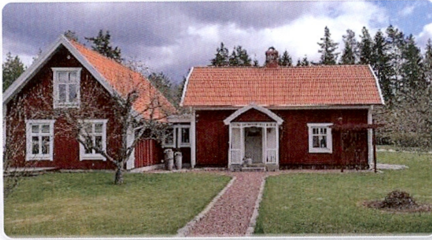
Gungsan tillbyggt på 20-talet.