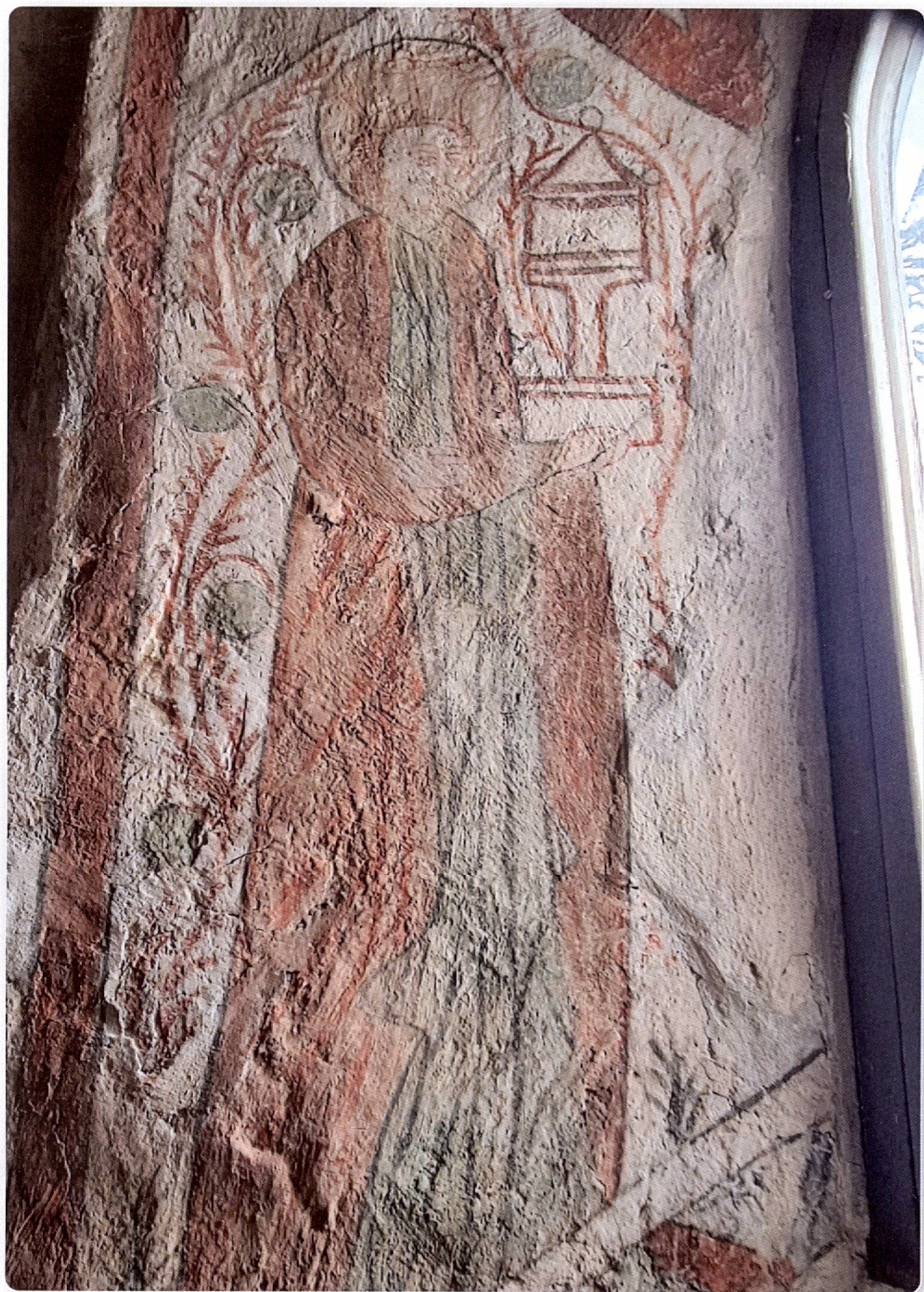
Sankta Barbara, Marbäcks kyrka.