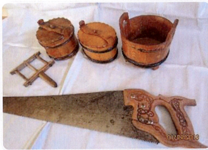
Johans olika hobbyarbeten.