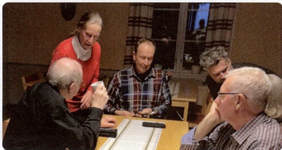
Fototräff i Bygdegården.

båda tillhandahölls av Hembygdsförbundet. I den senare kunde föreningar lägga upp sitt bildmaterial men även registrera personer kopplade till ev. foto/gård. Under 2017 talades det om att hemsidan skulle moderniseras och ev. läg-