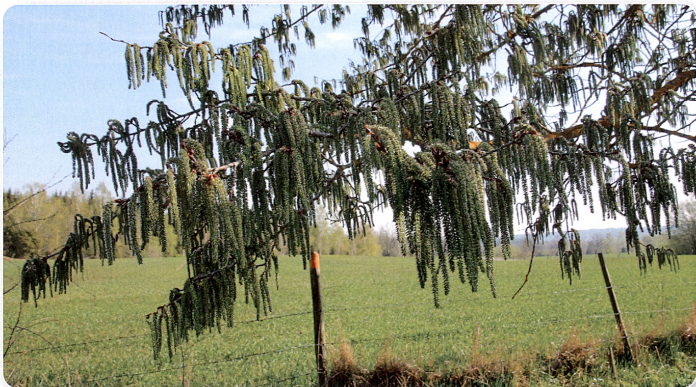
Aspen blommade på ett mycket rikligt sätt under sommaren 2019. Hängen och senare "moln" av frö som sällan har skådats.