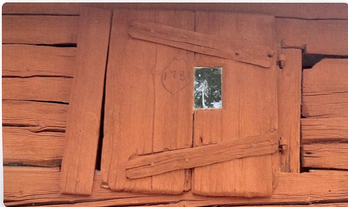
På denna lucka fann vi årtalet 1781.

Under arbetets gång hittade vi ett par årtal inristade, bla 1781 på en vädringslucka och 1757 på väggtimmer under trappan. Golven i visthusdelen är mycket ålderdomliga av medeltida typ sk. Golvklover, tillverkade innan möjligheten att såga golvplank fanns.