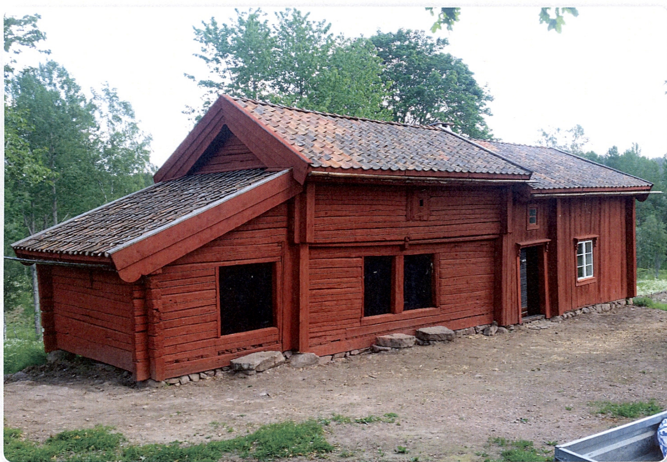
Esperödjan efter restaureringen, utförd 2019.

Avslutningsvis tycker jag att Esperödjan är ett bra exempel på hur den enkla människa levde på 1700-1800 talet och är viktigt att spara så människor i framtiden har en möjlighet att se hur vi levde i en svunnen dåtid.