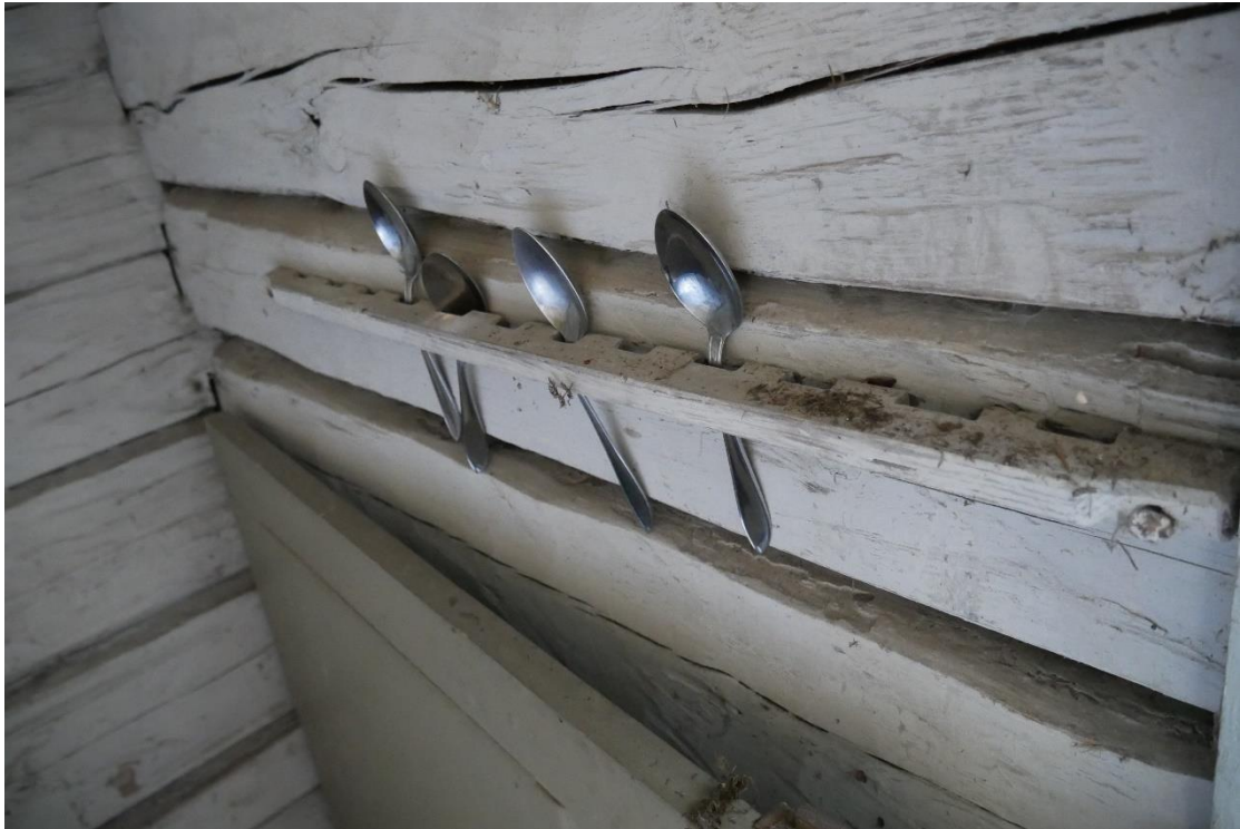
I köket finns en hållare för fattighjonens skedar.