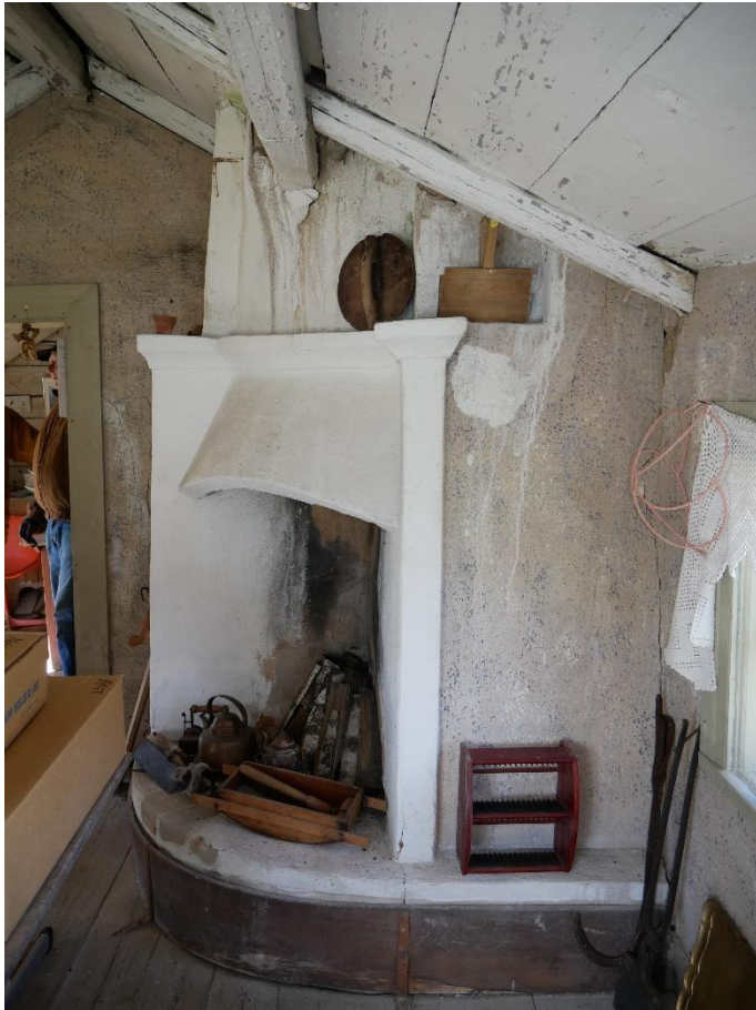
Ydrespis i norra takfallet med svep av trä.