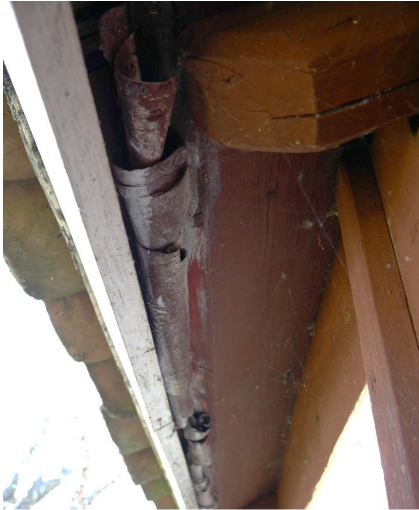
Under tegelpannorna finns näver kvar på norra takfallet.