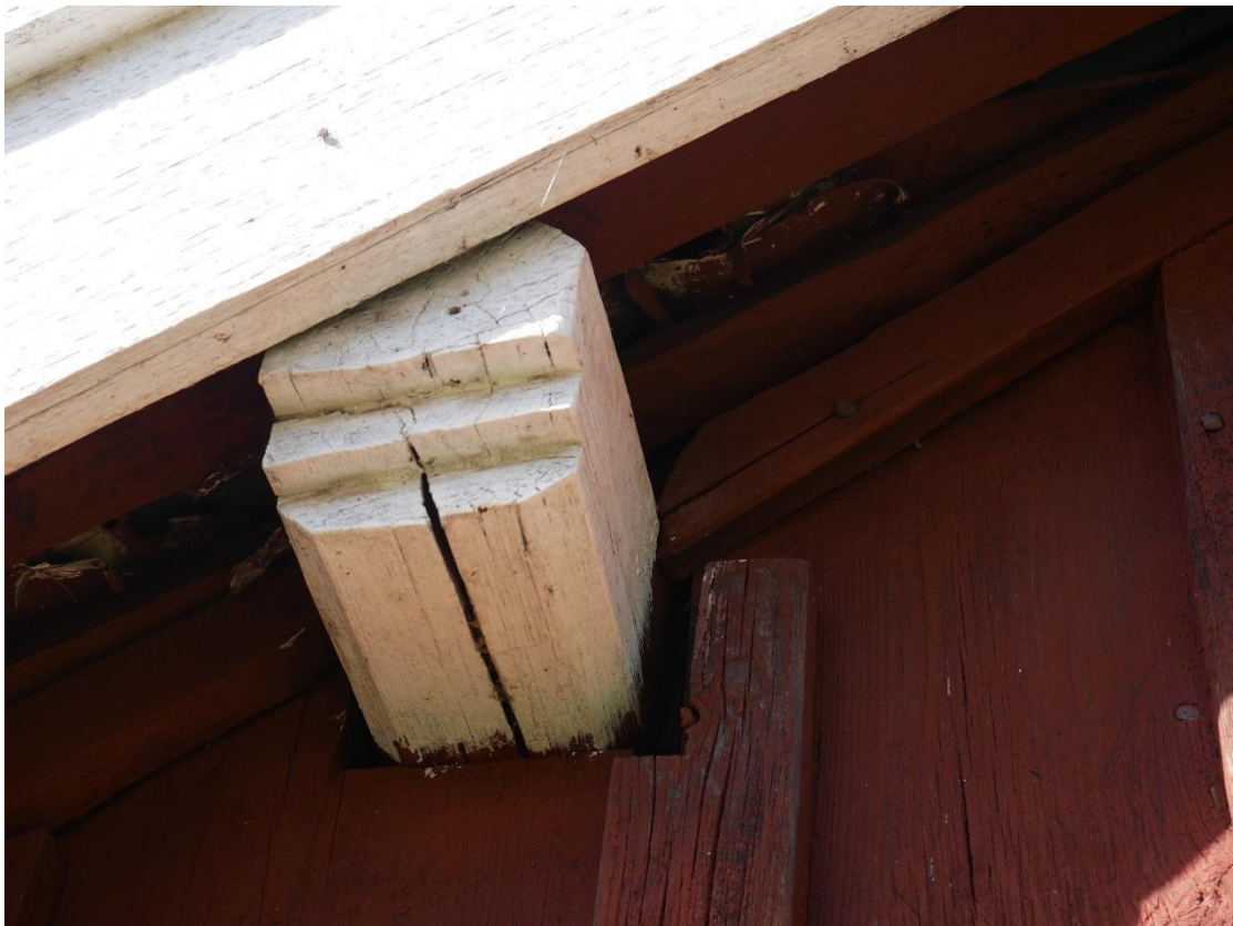
Åsarna har ett dekorativt avslut (droppnäsa) på östra gaveln.