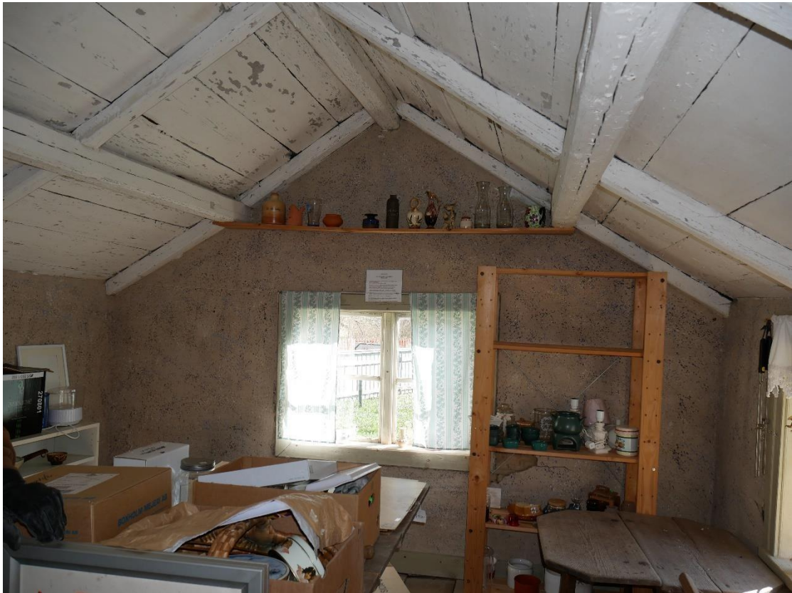
Stugan med synlig takkonstruktion. Väggarna är klädda med lerklining som sitter på reveteringshugg i timret.