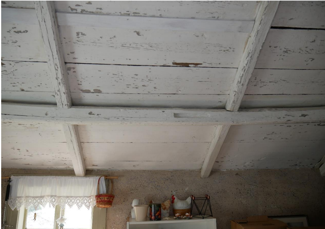
Urtag i sidoåsar efter ett innertak, så kallat tredingstak.