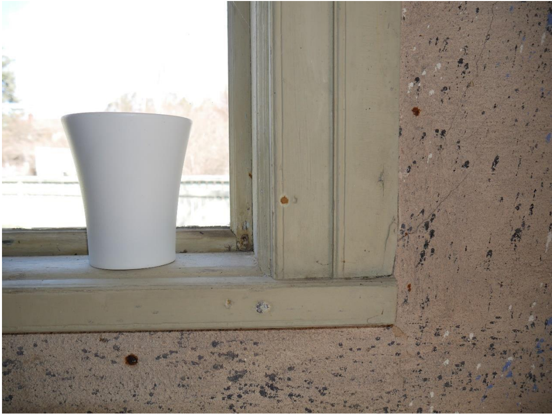
Detalj foder till fönster på norra sidan.