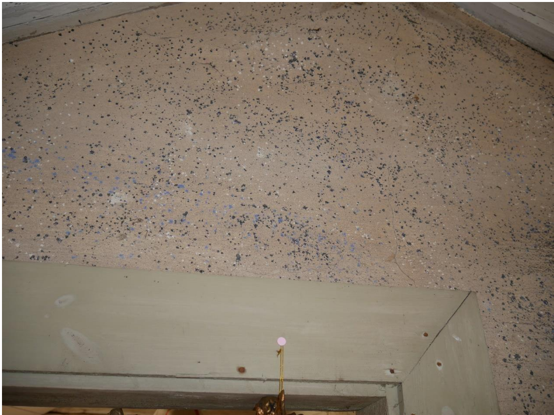
Stänkmålning i stugan över dörrfodren.