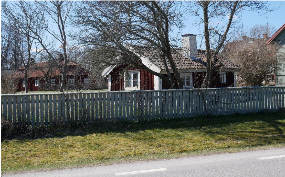
Fattigstugan ligger nära vägen. Till vänster i bild skymtar Birgittastugan, flyttad från Aspenäs.