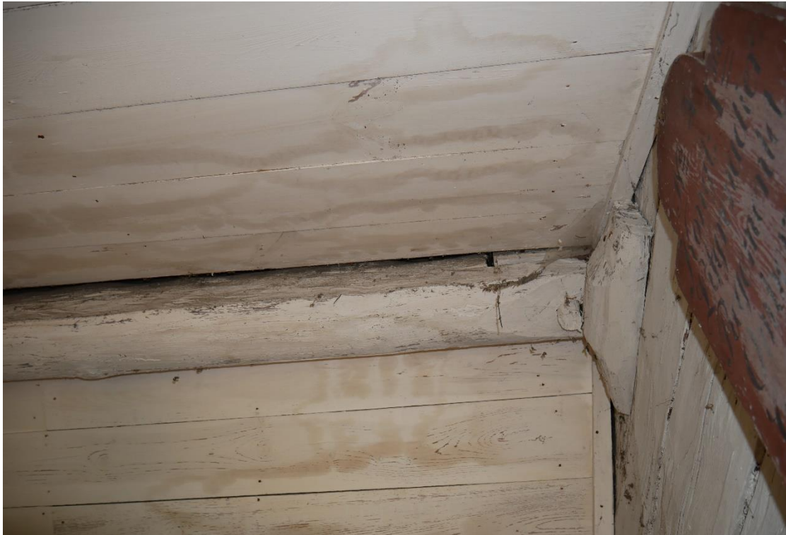
Förstugan med kroppåsens skarvning och upplag.