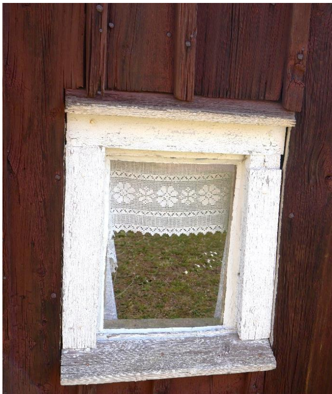
Fönsteröppning på västra gaveln in till förstugan.