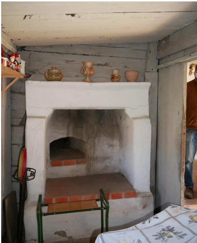
Sentida om murad spis med bakugn i köket.