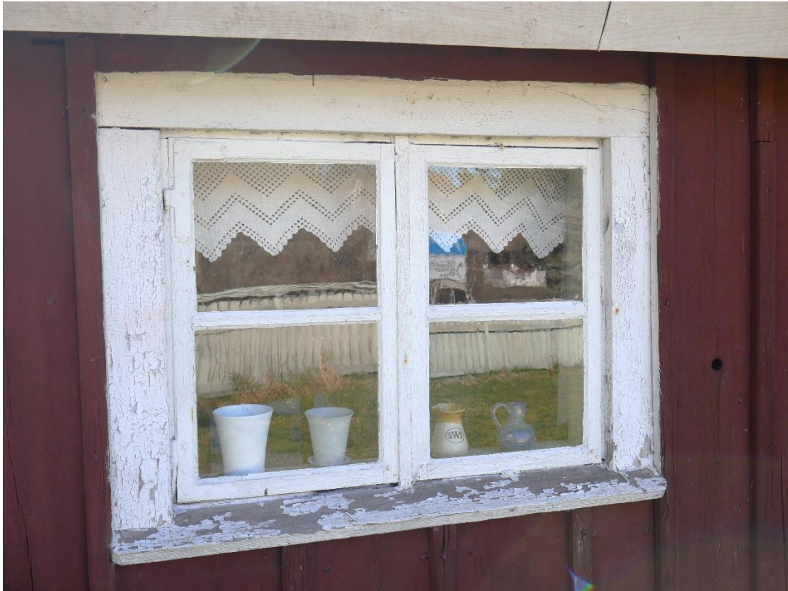
Fönsterbågar och fast mittpost in till stugan.