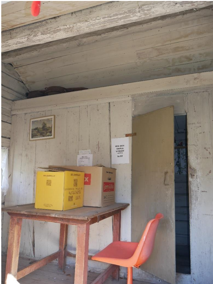
Mellanvägg av brädor mellan kök och förstuga. Dörren består av en enda bräda.