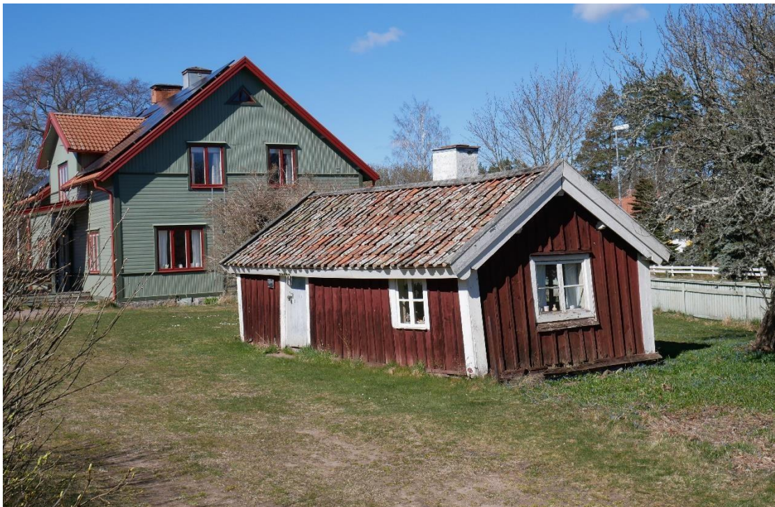
Fattigstugan som blev café är numera grönmålad. Gamla fattigstugan är sig lik. Framför de båda byggnaderna gick tidigare vägen genom byn.

Stugan står på stoppstenar av natursten med fyllning av granitstenar. Väggarna är uppförda av liggande timmer och fasaderna är klädda med en bred locklistpanel som är spikad med handsmidd spik. Knutbrädorna är vitmålade men har varit faluröda. Sadeltaket är belagt med handslaget enkupigt lertegel. På norra gaveln är delar av nävertaket synligt. Skorstenen sitter i norra takfallet och är vitmålad. Åsarna på östra gaveln har huggna droppnäsor. På västra gaveln saknas denna dekor. Här är åsarna släta. Nocken är belagd med brädor. Vindskivorna har en enkel profil. Även dessa har tidigare varit faluröda. Fönsterbågarna är alla olika. På östra gaveln sitter det största fönstret och bågen in till förstugan på västra gaveln består av ett mindre enlufts-fönster. Övriga bågar är spröjsade. Dörren är en narad bräddörr som består av tre brädor och har spår av en gråblå kulör.