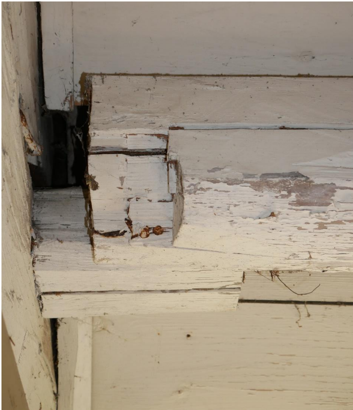
Förstugan där sidoåsen är skarvad vilket tyder på att stugan är tillbyggd.

Ett av fönsterfodren har profil som är vanlig under empiren. Samtliga snickerier är målade i en grågrön kulör.