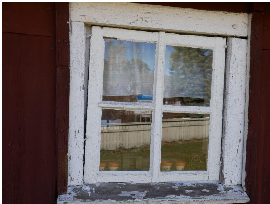
Fönsterbåge på norra sidan in till köket.