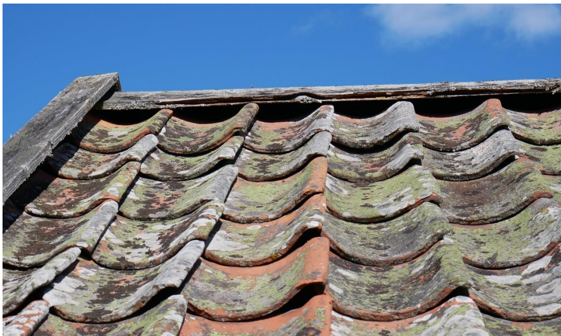
Nockbrädan har rötskador och skurlister är uttorkade.