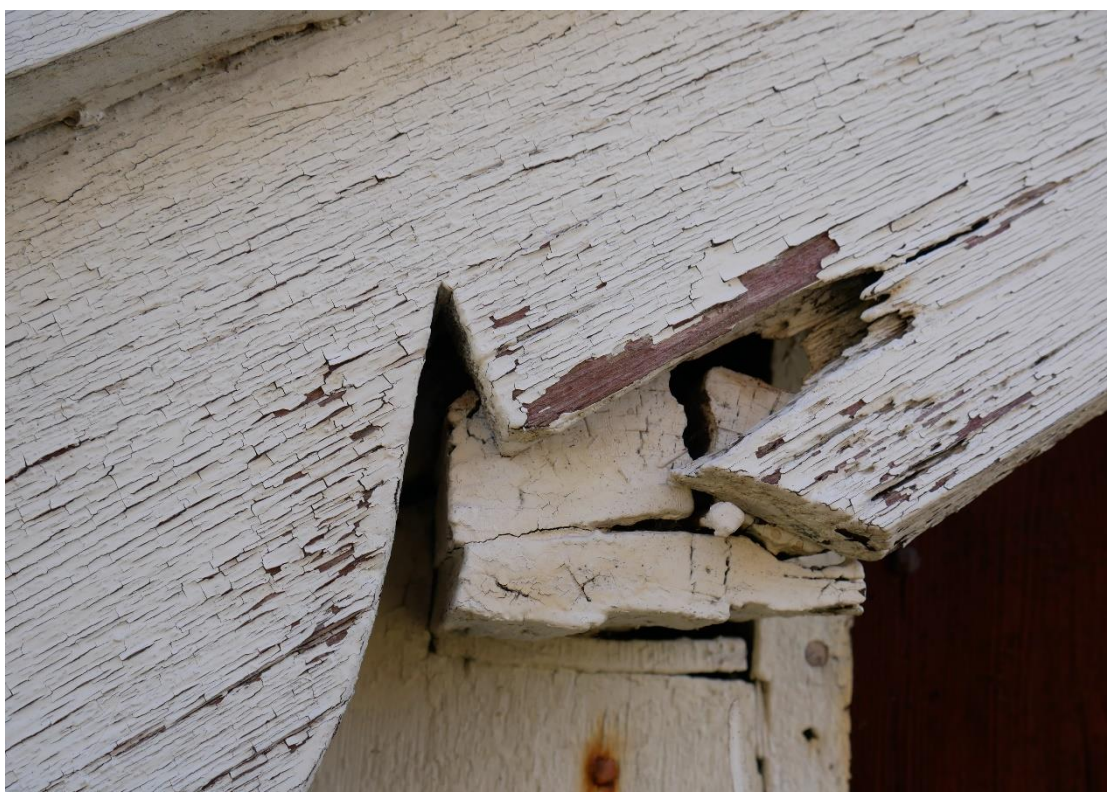
Vindskivan på västra gaveln har en rötskada som även har påverkat sidoåsen.