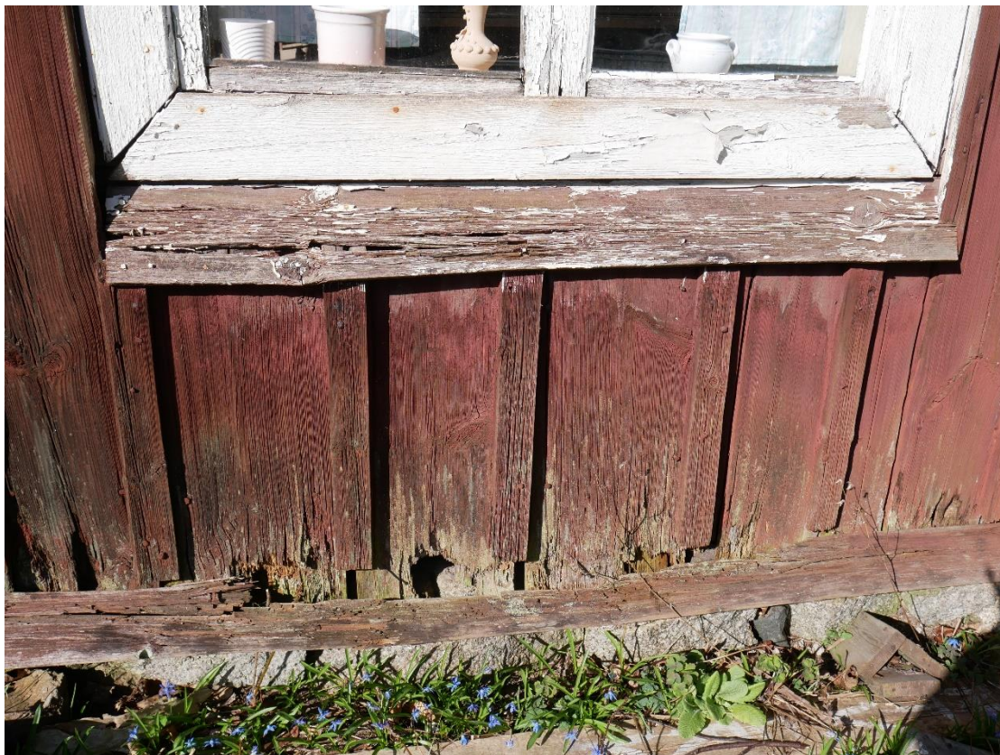
Delar av syllan är borta och panel samt vattbräda och fönsterbräda är rötskadade.