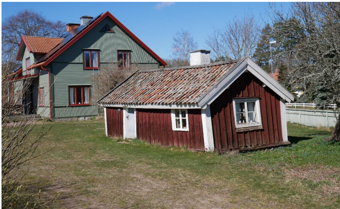
Stugan har sjunkit och lutar.

Lerkliningen släpper i anslutning till den skadade östra väggen. Om byggnaden renoveras med syllbyten som följd kommer det att bli ytterligare skador på lerkliningen.