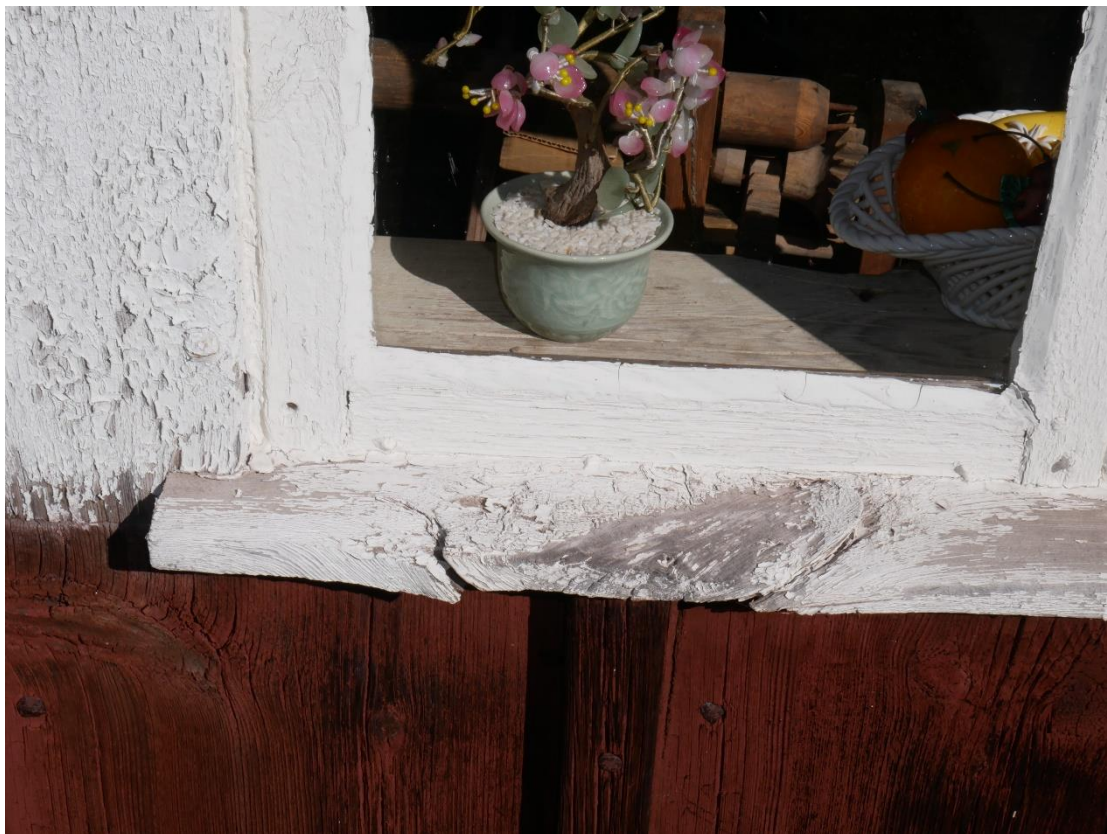
En fönsterbräda som till stor del består av en kvist.