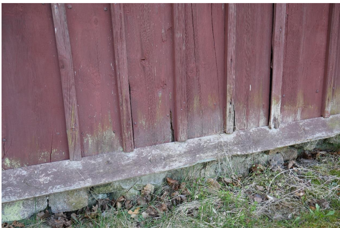
Rötskador på locklistpanel och vattbräda.