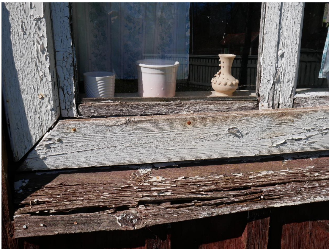
Även fönsterbågen är uttorkad och skadad.