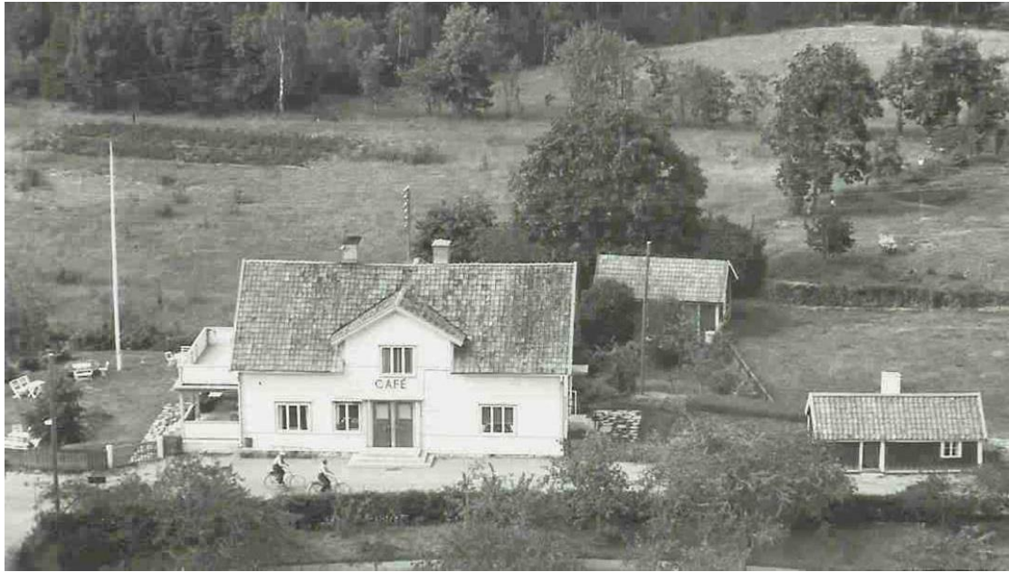
Foto troligen från 1940-talet. Den vita byggnaden är byggd som fattigstuga men brann och fick sin utformning 1908. Blev sedan café. Till höger syns gamla fattigstugan.