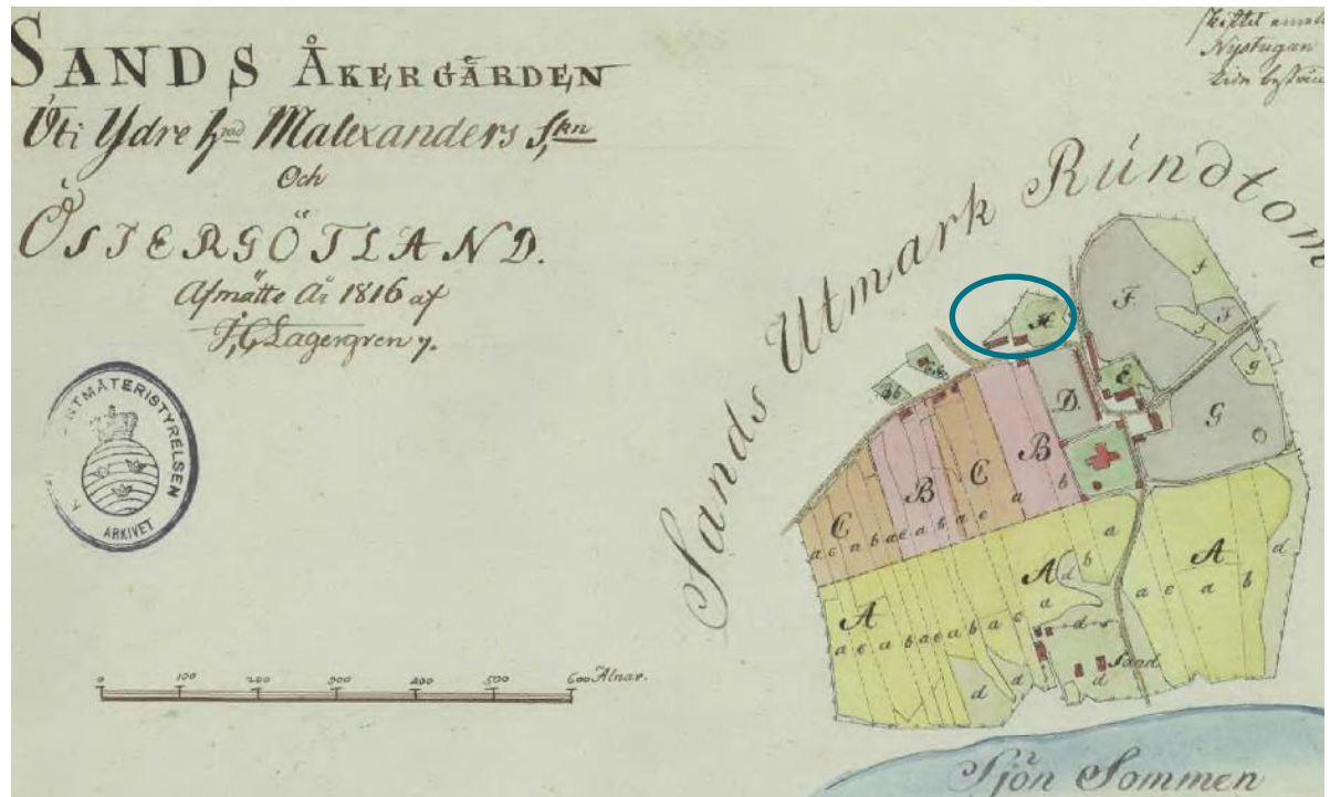
Fattigstugans läge i byn 1816. Byggnaden till höger är Fattigstugan.