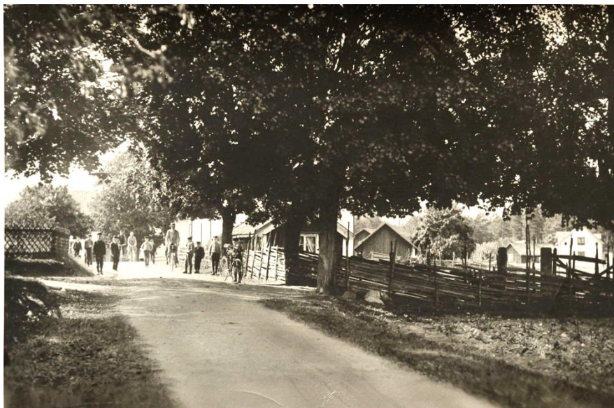
Äldre foto där fattigstugan skymtar innanför gårdesgården. Gamla vägen framför stugan.