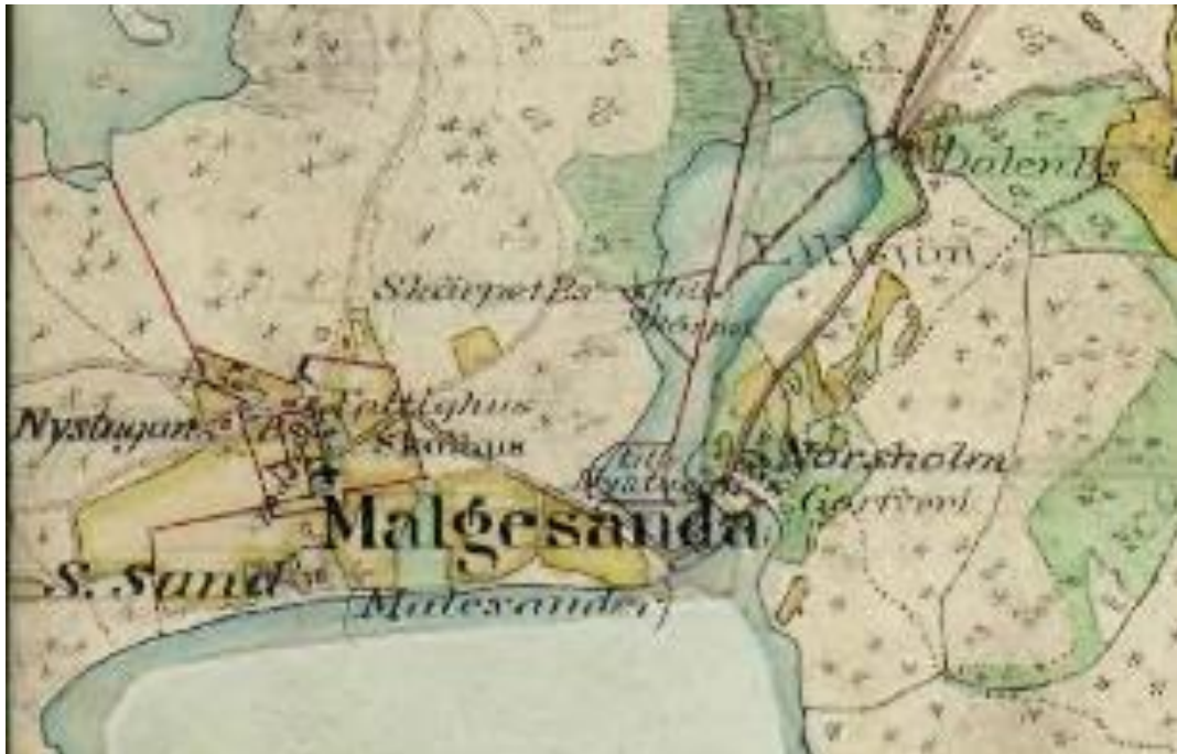
På Häradskartan från 1867-77 finns fattigstugan utmärkt.