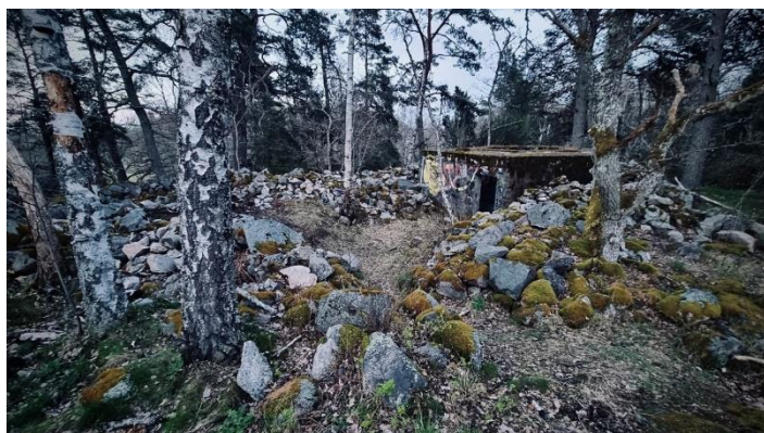
Skyttevärn på Önstensborg

I mitten av Önstensborg står ett skyttevärn kvar än idag och rykten säger att det finns fler kvar i omgivningen. Trots att fornborgen inte återställdes helt i sitt ursprungliga skick är skyttevärnets ytterligare ett kulturarv som berättar något om vår historia.