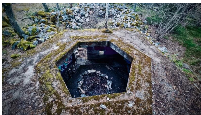
Skyttevärnets öppning på Önstensborg