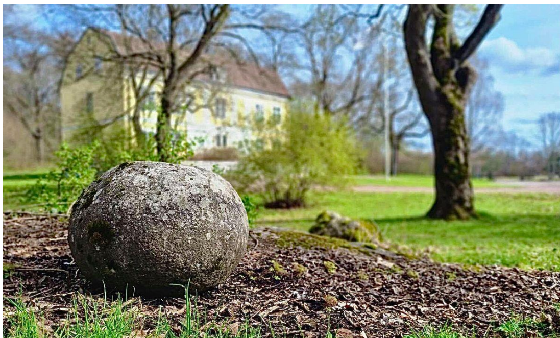
Stenklot vid Johannisbergs herrgård