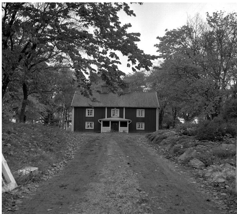
Bild 2. Uppfartsvägen mot huset ifrån söder. Bilden ifrån mitten 1960-talet, de stora träden i bakgrunden på båda sidor finns kvar 2017.