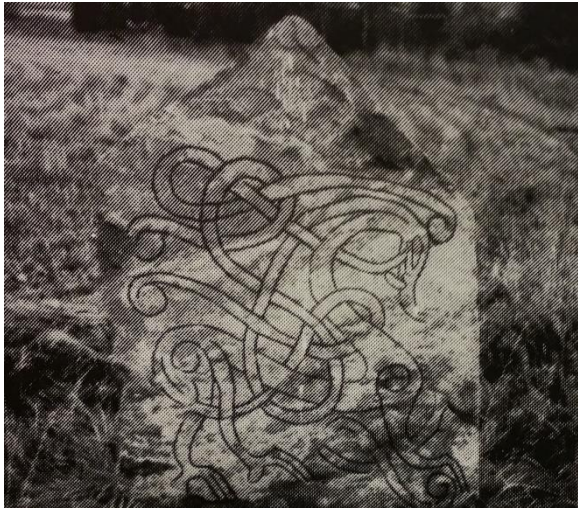
Bild 3. Södra runstenen