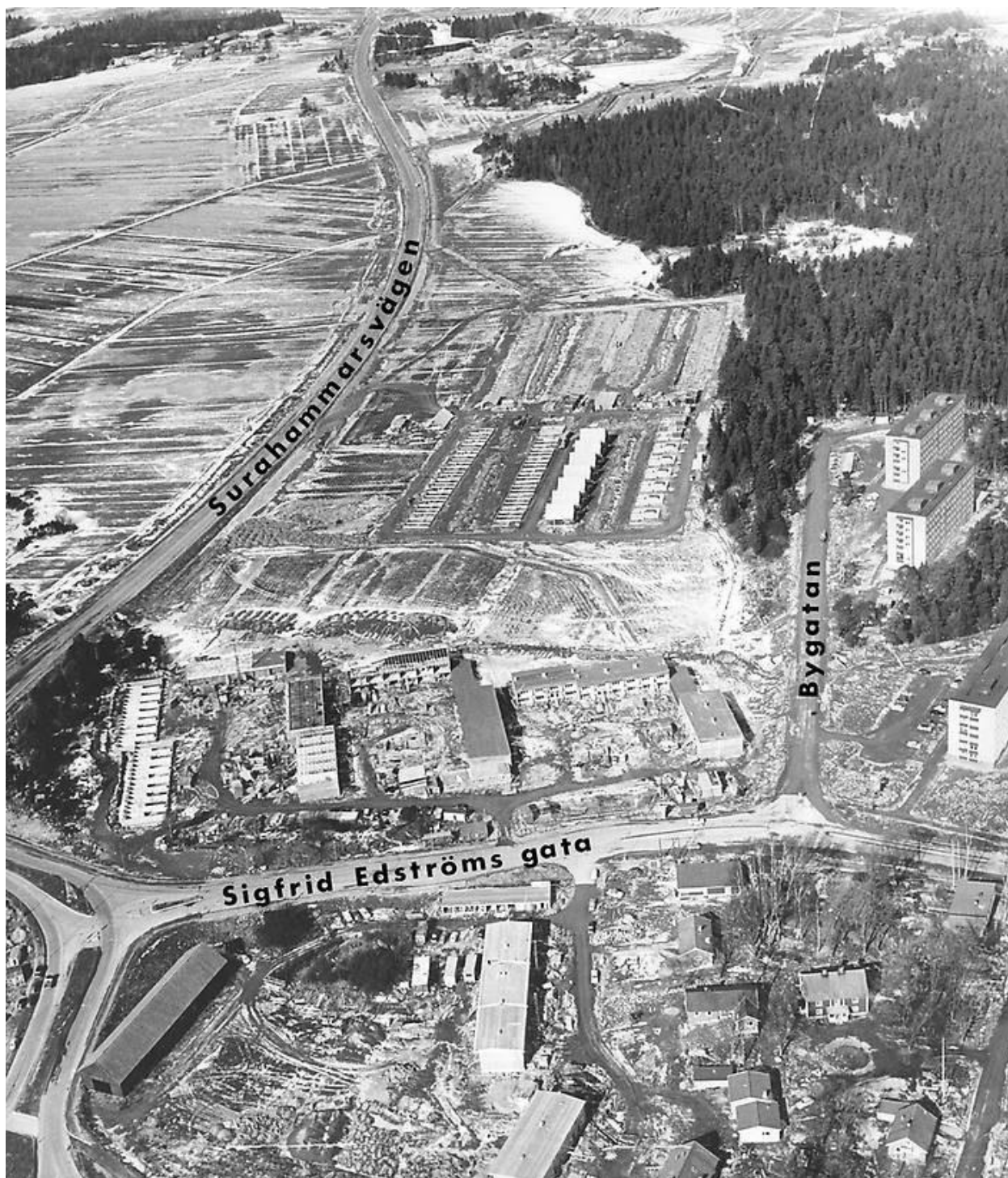
Bild 6. Denna bild är tagen 31 mars 1965, området bebyggt med bostäder. Ännu finns delar av gården kvar längs ned till höger.