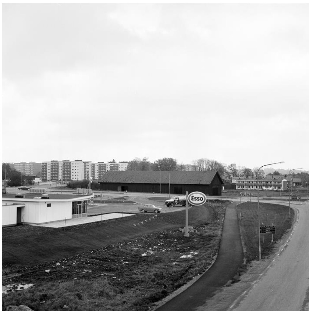
Bild 5. Endast ladan ifrån Hammarby Gård finns här kvar, troligen i slutet av 1960 talet.

Hammarby Gård revs någon gång 1967-68 efter åtminstone 300 års gammal historia. Förbi Hammarbys sista gårdstomt rusar nu trafiken förbi, de hastigt farande vet inte, att deras färd här går över gravar (se bilaga 1) i tredubbel bemärkelse över gången tid över månghundraårig odling, och särskilt vid ekdungen över ett gravfält med deras stoft som först började bo och bygga och odla jorden där en gång. Nu har det förvandlats till bostadsområde.