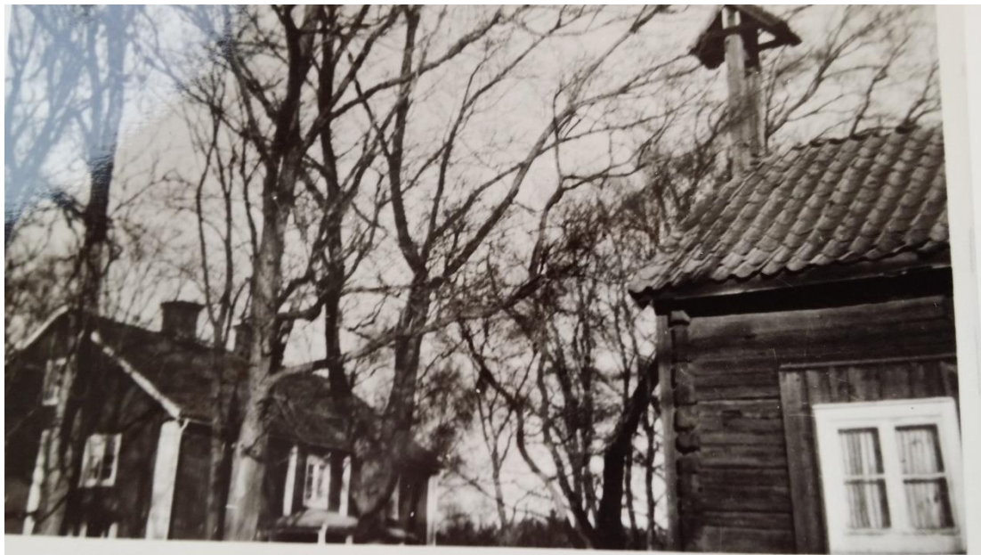
Bild 1. Huvudbyggnaden på Hammarby gård till vänster och uthus med endagsverksklocka till höger. Bilden tagen troligtvis i början av 1900-talet