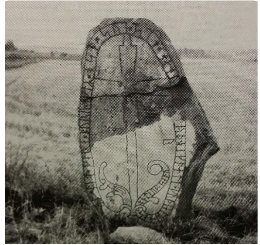
Bild 4. Norra runstenen

Hundra år har gått sedan jord i Hammarby av Karl Knutsson och hans fru Katarina gavs till klostret och ett kapell byggdes där. In på 1500-talets första hälft 1520 så har själamässorna med sångerna och Bönerna till "domen" tystnat, kloster och kapell har rivits och jämnats med marken. Vart den till klostret donerade Hammarbyjorden tog vägen vid klostrets förstörelse vet vi inte, troligen tog Kronan (Staten) hand om allt av värde.