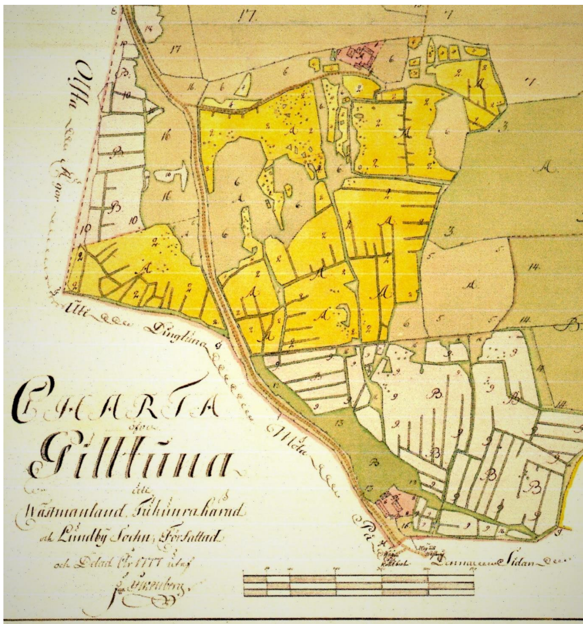
Karta över Gilltuna 1777. Det finns även en samling hus nere till höger kan inte få fram vad det skulle vara för hus eller gård.