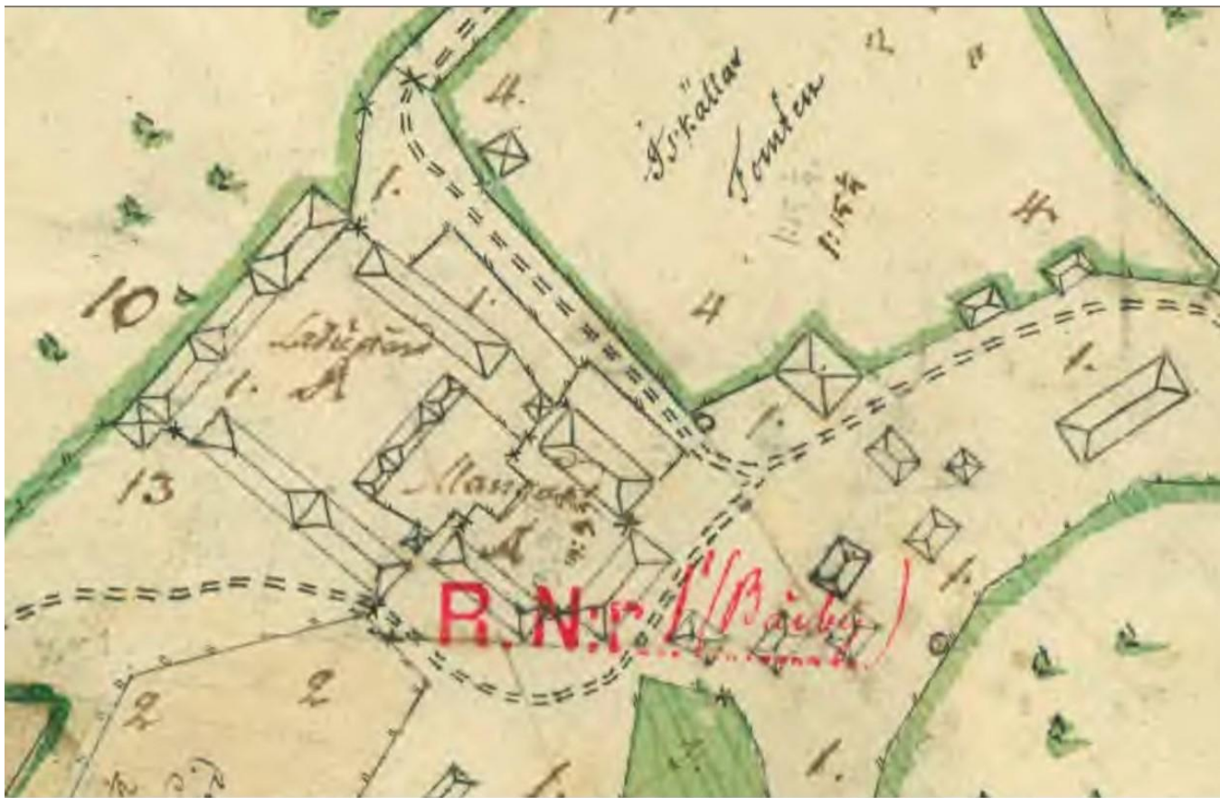
Bild nr 1 över Bärby år 1780 då Abraham Törneros var ägare till gården.