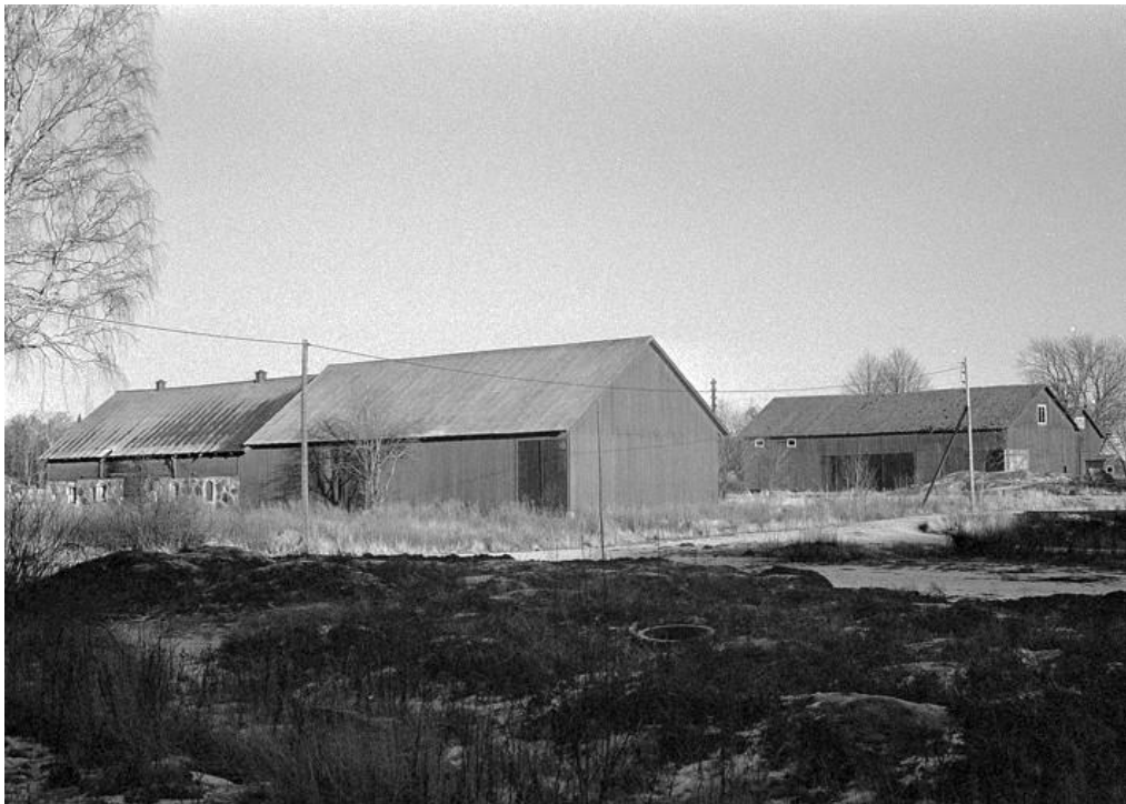
Storgården ladugård och loge från V, bild tagen 1975