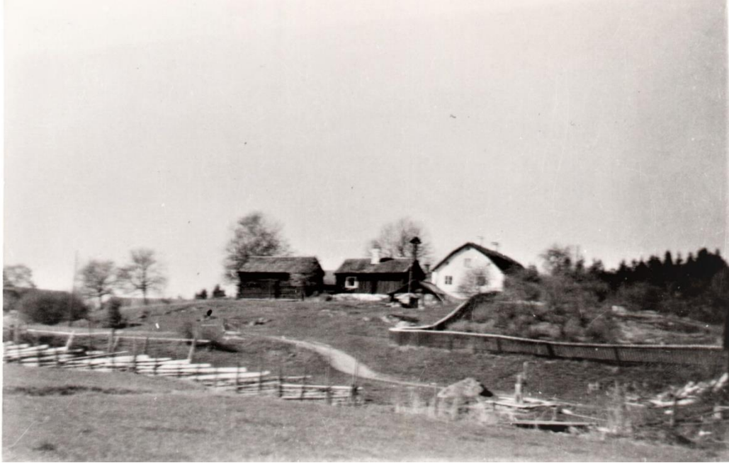
Bäckby Storgård i text kallad nr 1. Okänt årtal