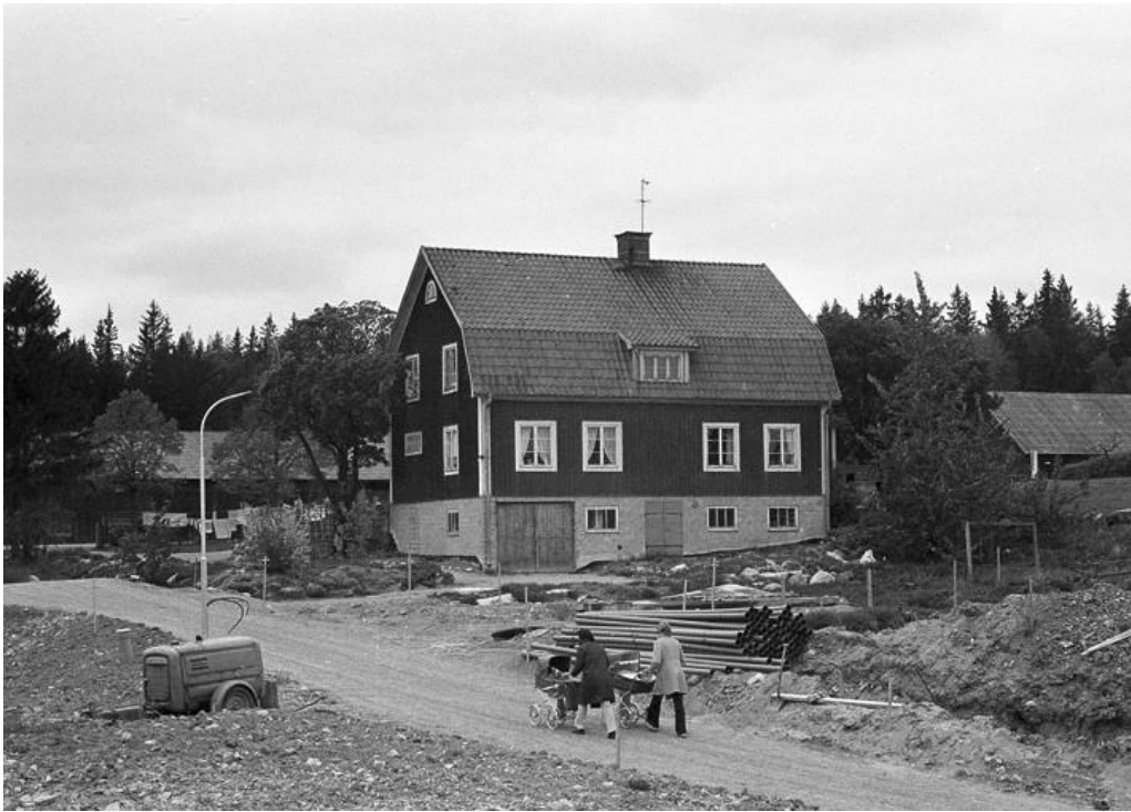
Cykelbanan med damer och barnvagnar går österut under suraleden, bild tagen 1975