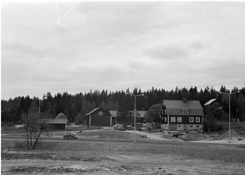
Lillgården bild tagen 1975 från Surahammarsvägen (Industrileden) bilen åker på vägen till återbruket idag.