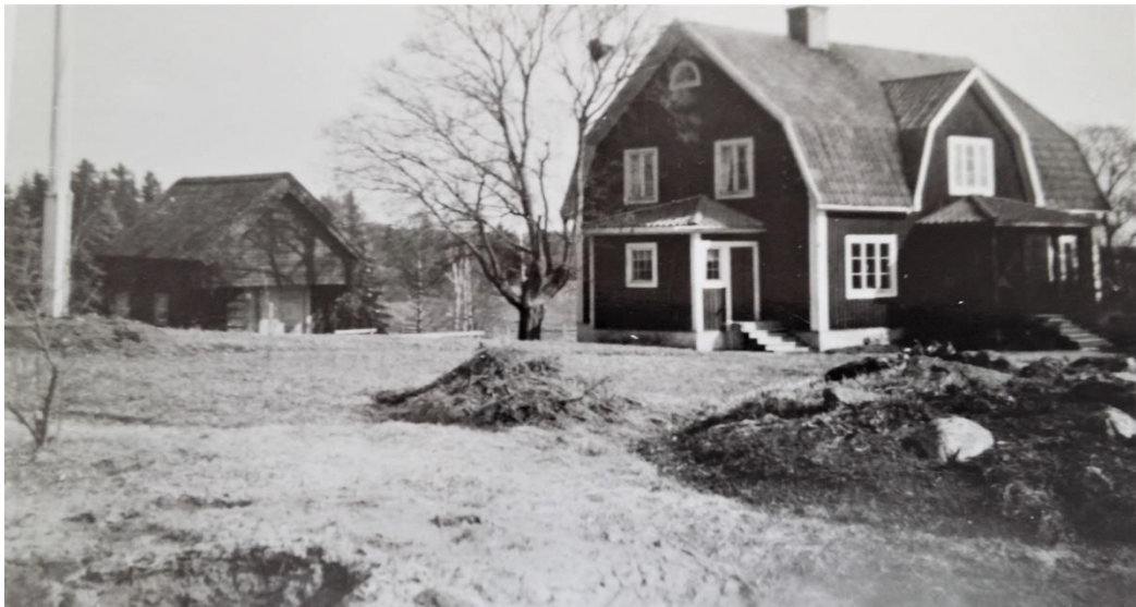
Bäckby Lillgård i text kallad nr 2. Okänt årtal

Namnet Bäckby har gården har gården har gården givetvis redan vid dess bebyggelse fått av bäcken som rinner genom dess ägor och tätt förbi gårdens smedja. Tillägget by kan man kanske förmoda att den fick då den bestod av 2 st gårdar, nämligen Storgården som var ett Rusthållar hemman samt Lillgården vilken var en cronogård och senare academigård. Nu är bäcken liten och obetydlig