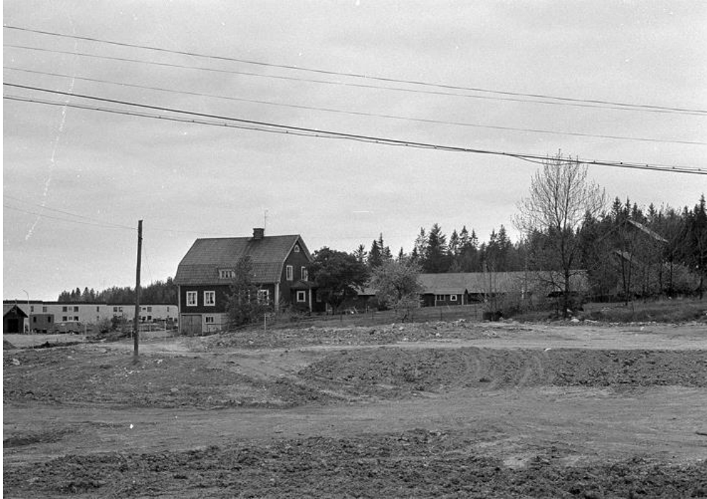
Boningshuset på Lillgården, till vä nybyggda bostadslängor på Adolf Zetelius Gata, bild tagen 1975