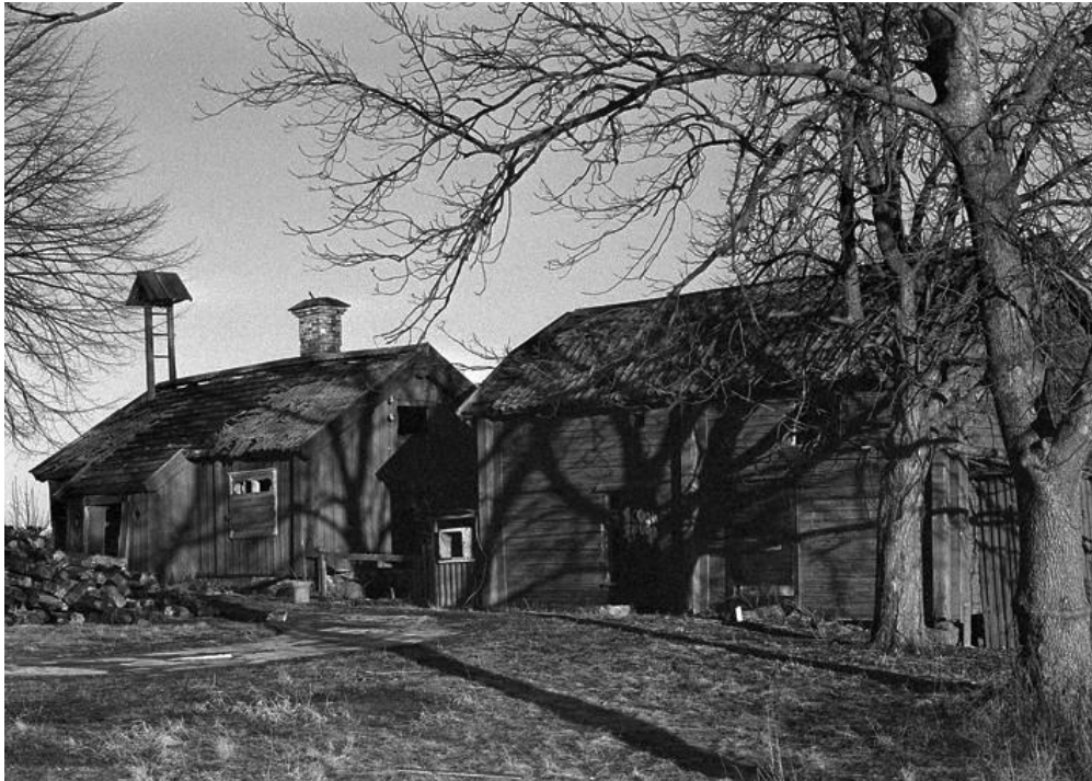
Storgården uthus med "grötklocka" från SV, boningshuset låg till vänster, bild tagen 1975