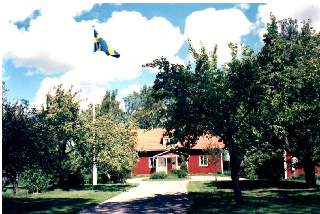
Mangårdsbyggnaden troligen någon gång 1950- 1960- talet.

Bilaga 1: Bilder ifrån gården 1975 Bilaga 2: Karta över husens placering på gården