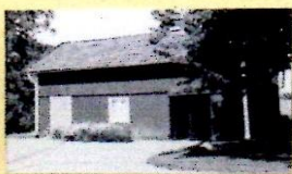
4:28 II 2