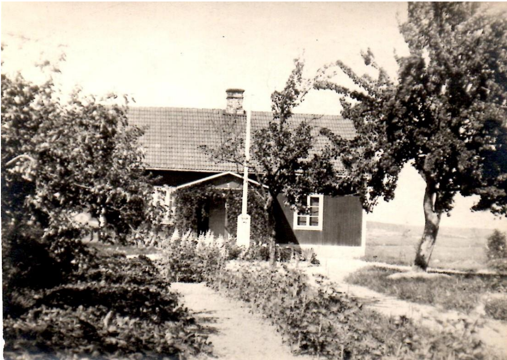
Mangårdsbyggnaden på Torp före 1918

Torp är en av de yngsta gårdarna i Lundby socken, för att inte säga den yngsta. Vid storskiftet 1779 så verkar det som om Torp och Önsta hörde ihop. Man tror även att Torp innan den nämndes som gård, varit utjord och torp till Önsta. Ett faktum är att Torp och Önsta tidvis sambrukats.