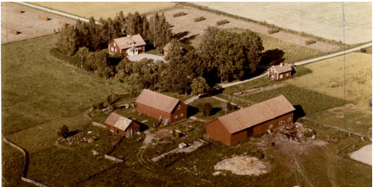
Flygfoto före 1955, traktorgaraget byggdes då och är inte med på denna bild.