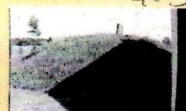
4:35 IX 8