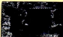
4:30 III 3