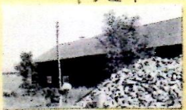
4:32 V 5