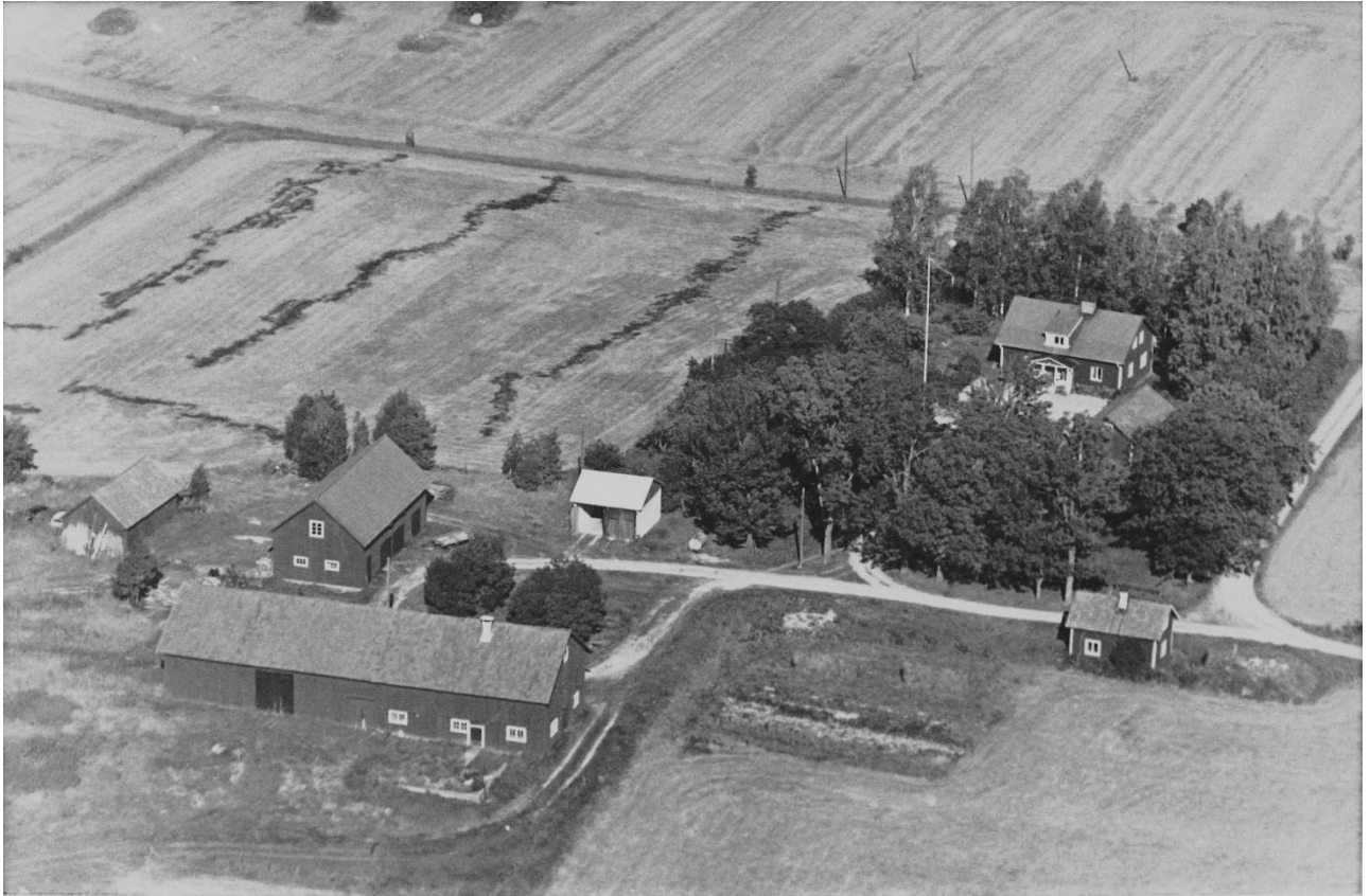
Flygfoto över Torp c:a 1960 -tal