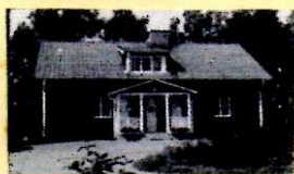
4:29 I 1

Situationsplan samt ev. beskr. av närmiljön