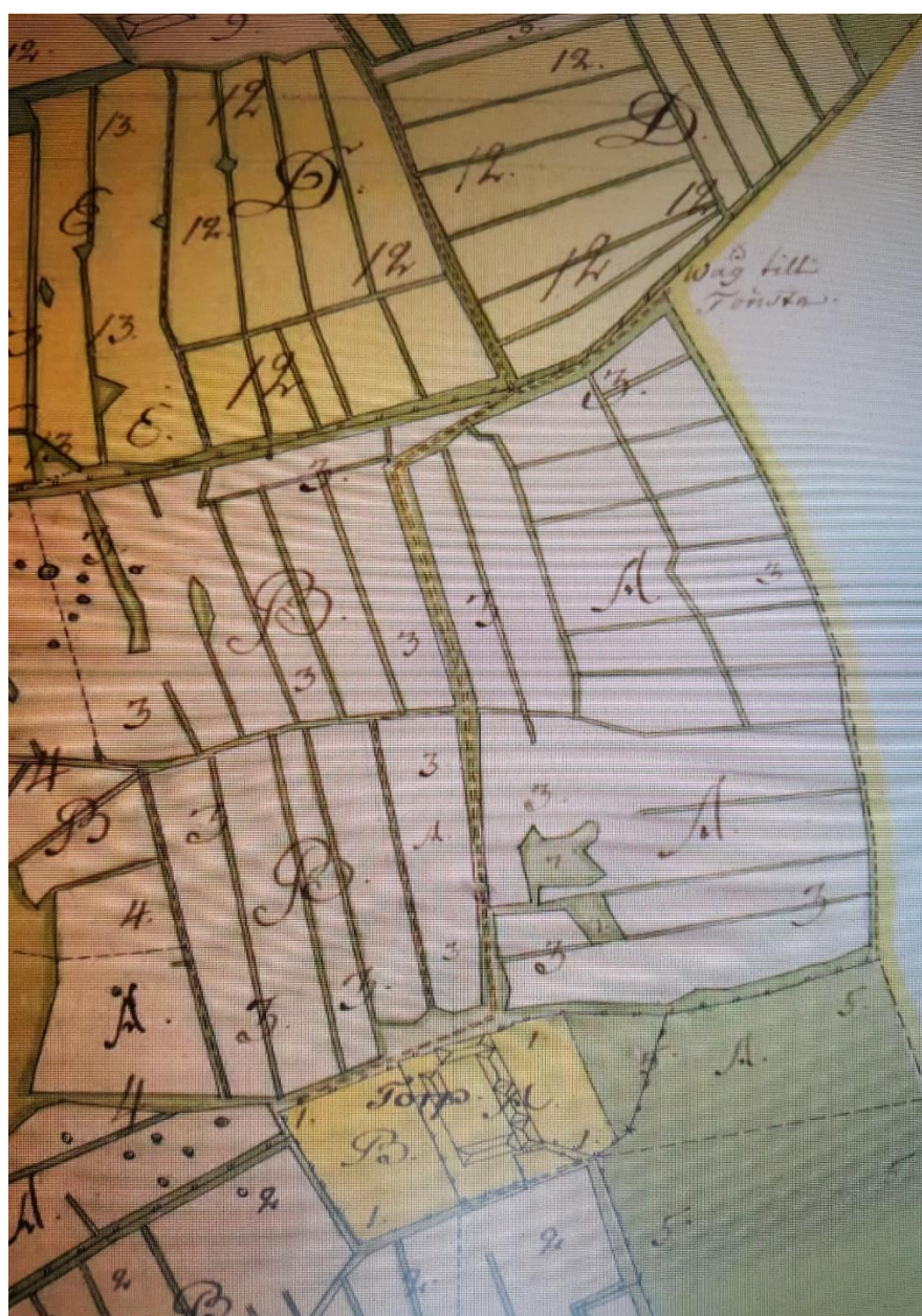
Karta över Torp vid storskiftet 1779