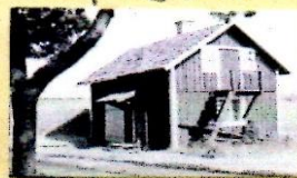
4:34 VIII 7