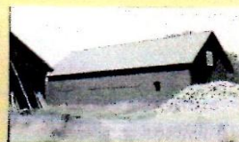
V VÄSTFASAD 4:33