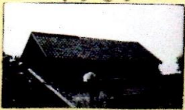
4:31 VI 6