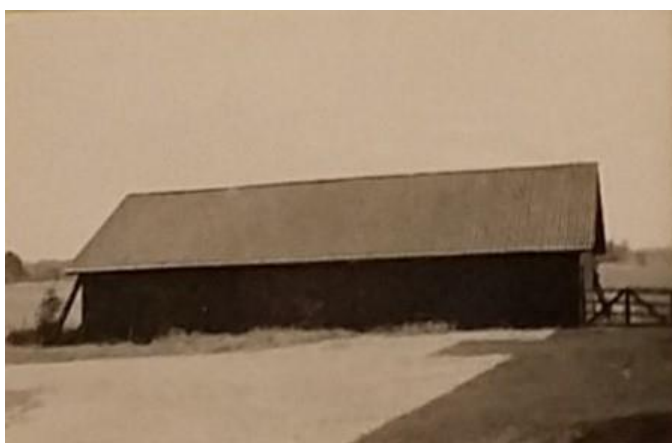
Bild V: Vagnslider från 1920-1930