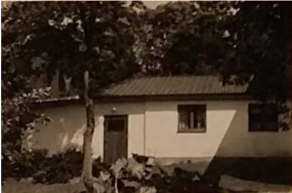
Bild 1: Utbyggnad av bostadshuset med kök och kammare 1918 på norra sidan av huset. 1960 tillkom även ett pannrum

Därefter står det ingenting om Tönsta förrän 1563 där det uppges i kyrkböcker att Tönsta ägs av en man vid namn Arvid Trolle