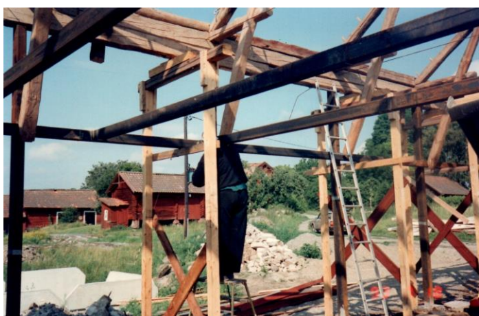
Stödkonstruktion under takbjälke för kunna flytta byggnaden i sidled.