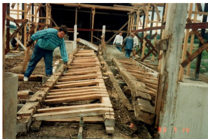
Stillbord med reglar rivs