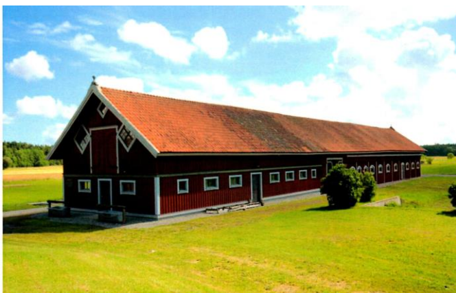
Stallet efter ombyggnaden 1994