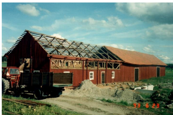
Taket på ladugården avtaget