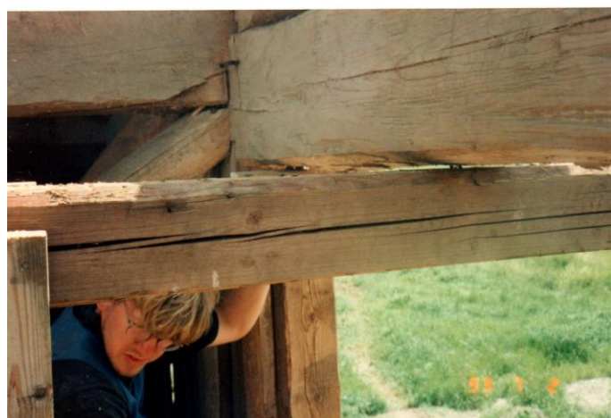
Mellan stödkonstruktionen och takbjälke användes grissvål (feta) för att minska friktionen vid sidoflyttningen