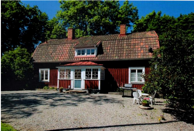
Mangårdsbyggnaden på Önsta I efter restaureringen i slutet av 1990-talet