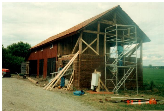
Magasinet under ombyggnad 1993