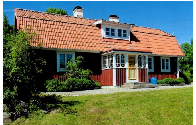
Mangårdsbyggnaden på Önsta II nybyggd 2000