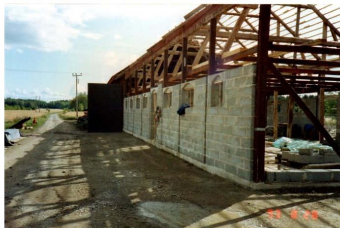
Östra väggen klar, till vä syns vägen till Torp