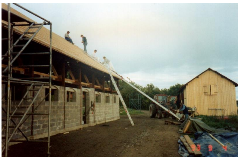
Undertaket läggs på sedan kommer teglet. Magasinet till vänster