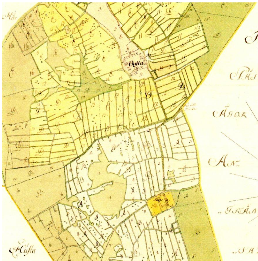
Karta över storskiftet 1779 på Önssta och Torp