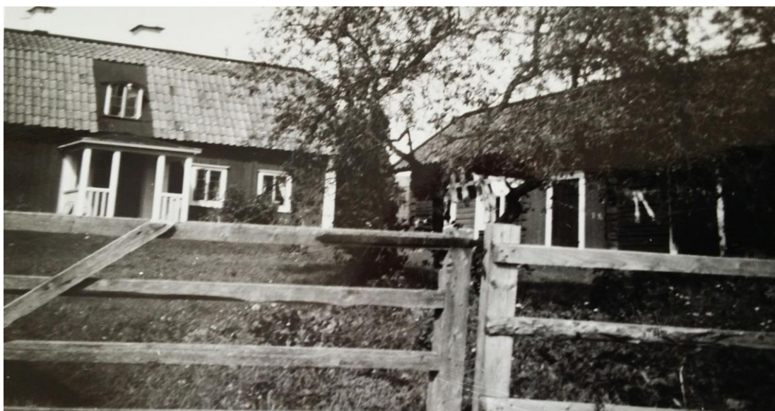
Önsta II, eller Västra Önsta som det också kallades, okänt vilket år. Mangårdsbyggnaden från i början av 1800-talet