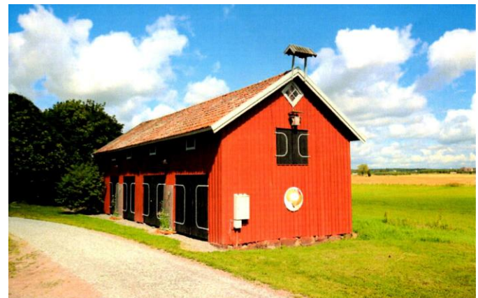
Magasinet efter ombyggnaden 1994