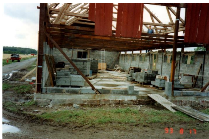
Golvet klart och nu muras väggarna med lecablock som sedan putsas.