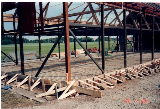
Formning av nytt golv samt järn-balkar i tak och väggstommar.