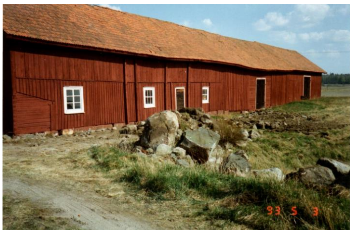
Ladugård och loge före ombyggnaden 1993