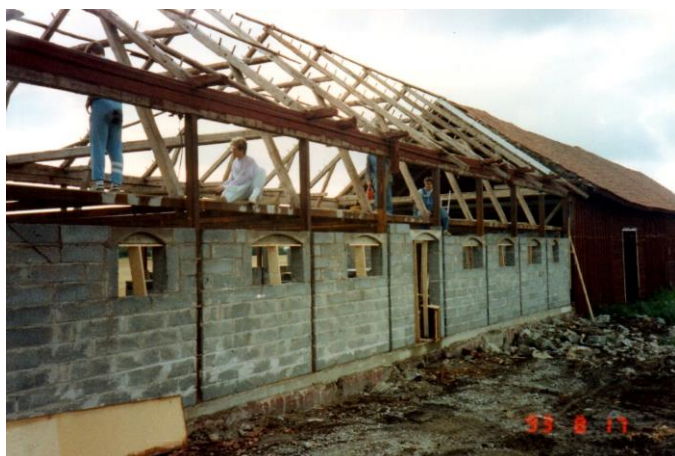
Västra väggen färdigmurad