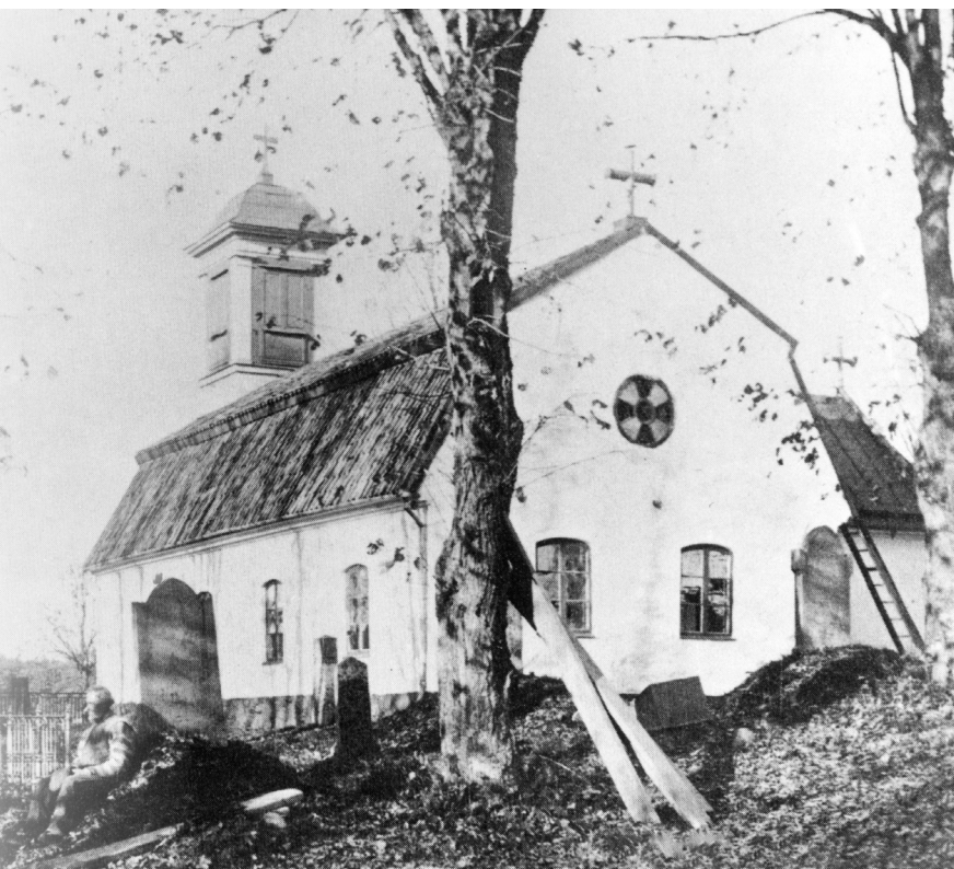
Lidingö kyrka före förlängningen 1913.