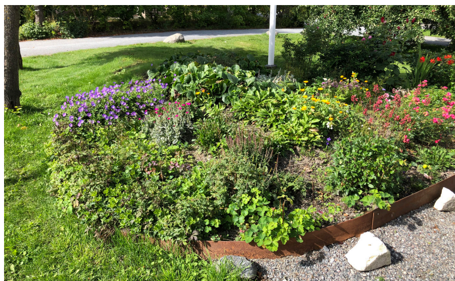
Våra vackra rabatter gläder både besökare och förbipasserande. Stort tack till Maud Lilja som med stort engagemang och gröna fingrar vårdar dem.

Kaffeserveringen tar gärna emot hembakade kakor och bröd, liksom marmelad, sylt och saft. Lämnas på S:ta Annagården lördag 21 oktober mellan kl. 9.00–13.00 eller söndag 22 oktober mellan kl. 9.00–11.30. ■