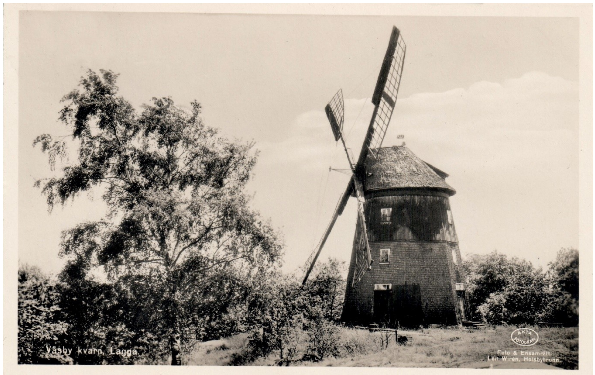
"Väsby kvarn, Lagga. Äkta fotografi.". Ca 1952.