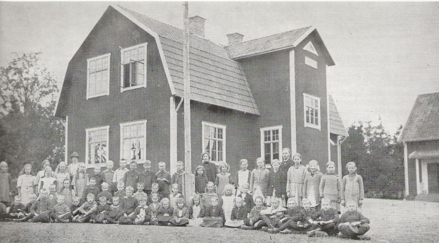
Efter ombyggnaden 1920 hade Laggas första skolhus denna exteriör och behöll den till rivningen 1963. Fotoår 1925. Till höger skymtar "Funbo-huset".