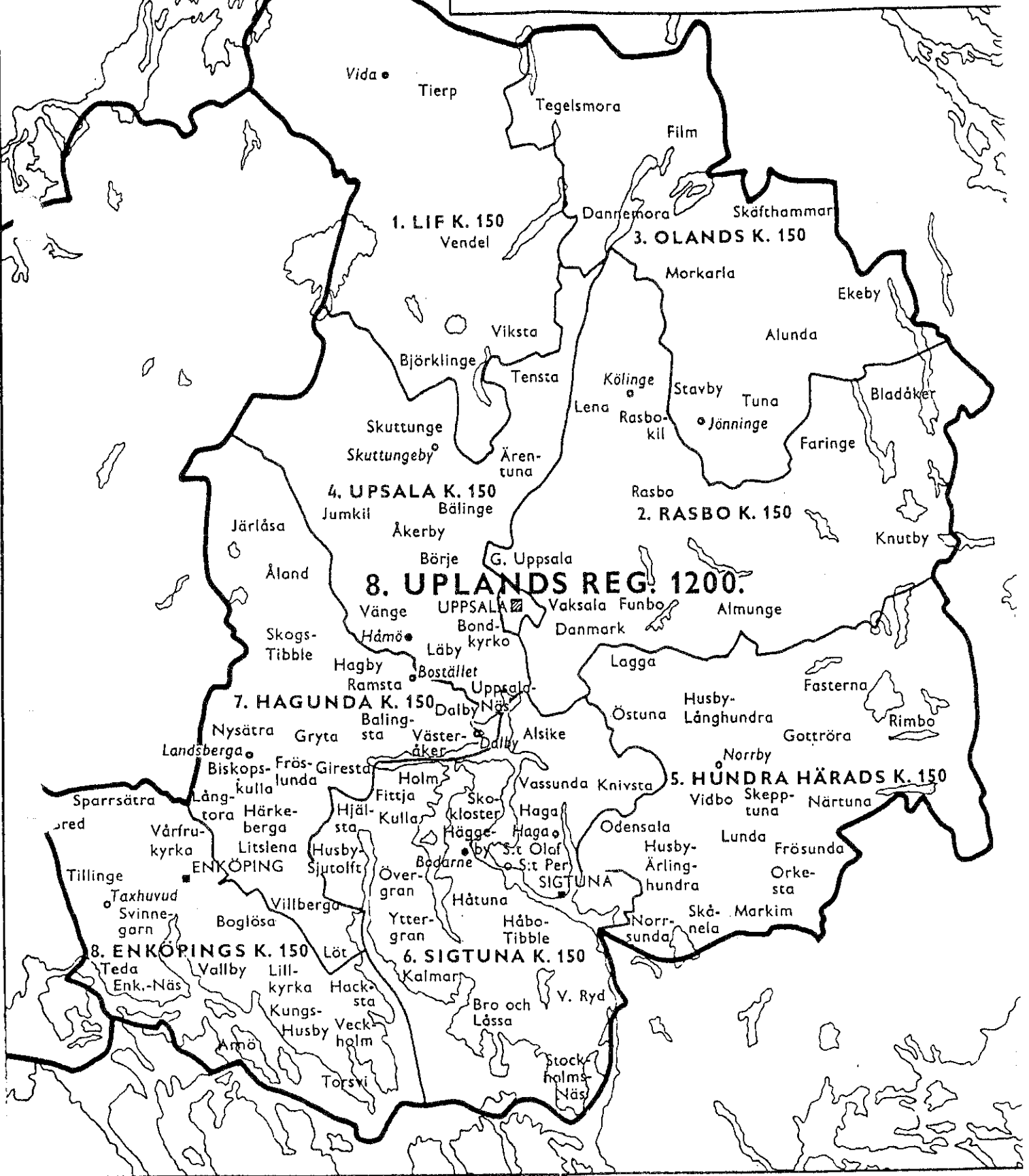
upplands regementes olika kompaniers och soldaters hemsocknar

utvisande kompaniområden, sockennamn samt bostället för regementsofficerare och kompanichefer.