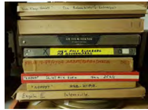
I Rogers klipprum