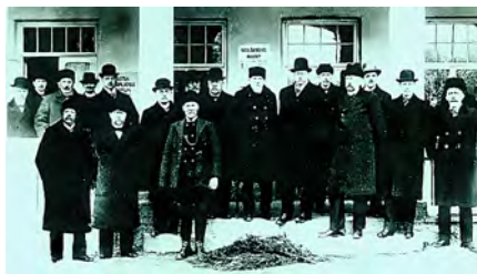
Östra Sörmlands Kulturshistoriska Förening ÖSKF framför det första museet i Badhuset.

Kulturhistoriska Föreningen i Södertälje samarbetar med ABF Södertälje-Nykvarn