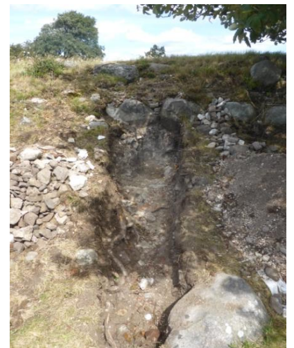
Tre öppna schakt runt kyrkkullen