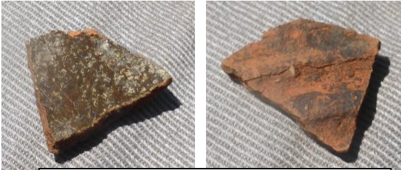
Tunn keramik med glaserad insida och vågformad utsida (ca 2 cm i kant)

I övrigt gjorde vi enstaka keramikfynd, spikar, porslin, någon flinta mm och rätt frekvent tegelfragment.