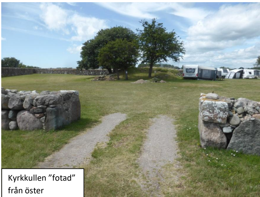
Kyrkkullen "fotad" från öster

Schakt runt kyrkkullen hade tagits upp under den första grävveckan och såg nu ut så här. De ansågs svåra att tolka vad gäller information om kyrkans mer exakta läge och storlek.