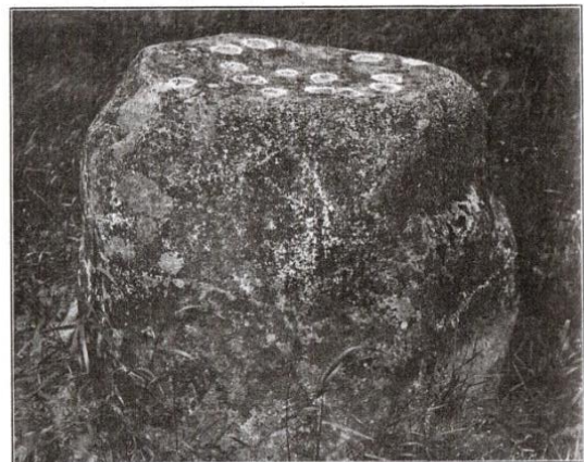
Fig. 5. "Altarstenen" vid Högnalöv i Uråsa.