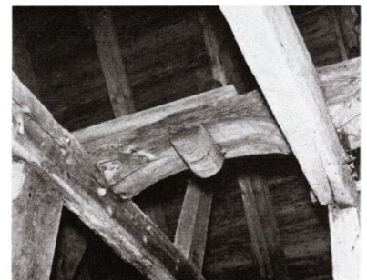
Drevs kyrka foto 1965 från "Sveriges kyrkor".