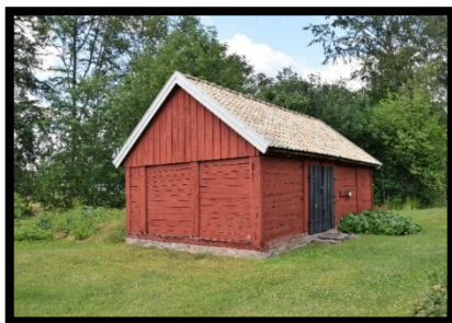
Forsbylängan år 2021