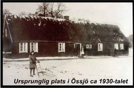
Ursprunglig plats i Össjö ca 1930-talet

Össjö krog är en korsvirkesbyggnad byggd på 1700-talet. Enligt praktverket "svenska gods och gårdar" byggdes detta hus åren 1725–1730. Den tjänstgjorde som krog i Össjö fram till 1896, varefter den användes som privat bostad, arbetarbostad och torparbostad. Stugan skänktes av godsägaren Otto Berch till hembygdsföre-