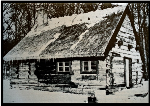
Vid Elfdalen 1954