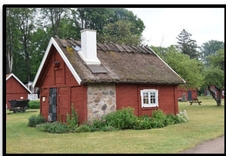
Soldattorpet år 2021 i Elfdalen