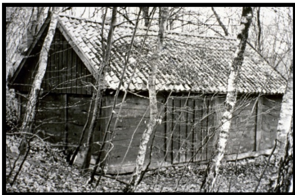
I Klöva Hallar

Forsbylängan är ett skiftesverk (bålebyggnad) från början av 1800-talet. Kommer från Adolf Nilsson i Lilla Forsby. Det är en ekonomibygnad i storlek 8,8 x 5 m och med årtal 1818 inhugget på gaveln. Den flyttades år 1955 till Klöva Hallar. 1987 flyttades den från Klöva Hallar till Elfdalen i Klippan. Längan inrymmer i dag gamla vagnar som tidigare drogs av hästar. Dessutom finns en samling med kälkar, slädar, sparkstöttingar samt olika kärror för transporter. En fin kistvagn som användes vid begravingar. Jaktvagn mm