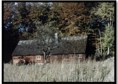
Vid Elfdalen 1958.