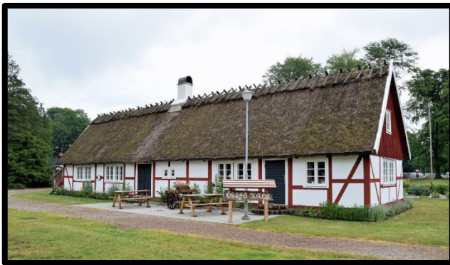
Össjö krog år 2021

Efter ett Leader-projekt som började år 2018 har Össjö krog blivit renoverat både utvändigt och invändigt. I ena halvan fanns två rum som har gjorts om till en större lokal, för att användas till olika tillställningar. Är också anpassat för kurser eller föredrag, fiberuppkoppling finns så man kan använda nutidens penna och papper det vill säga datateknik. En toalett har inretts och gamla köket har renoverats.