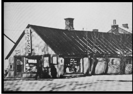
Huset vid Storgatan 26