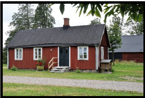
Tvärby stugan 2021 i Elfdalen