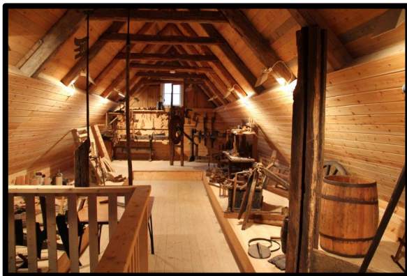
Vedbylängan år 2021