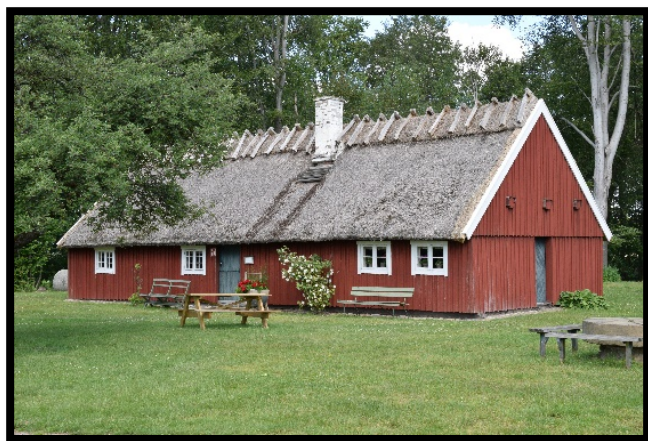
Ryggåsstugan år 2021 i Elfdalen

I stugan kan man se en tidstypisk interiör.