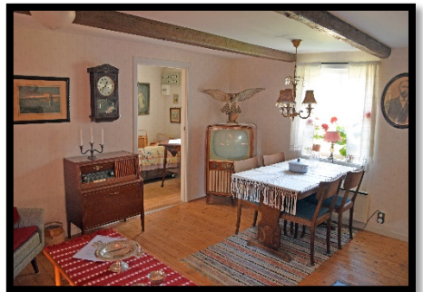
Interiör i vardagsrummet