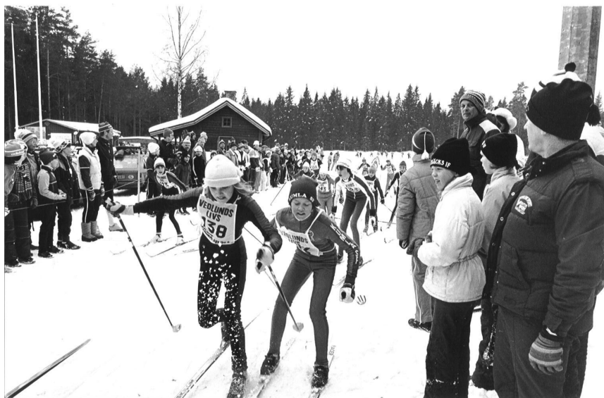
Skidtävling på Hallskogsvallen.