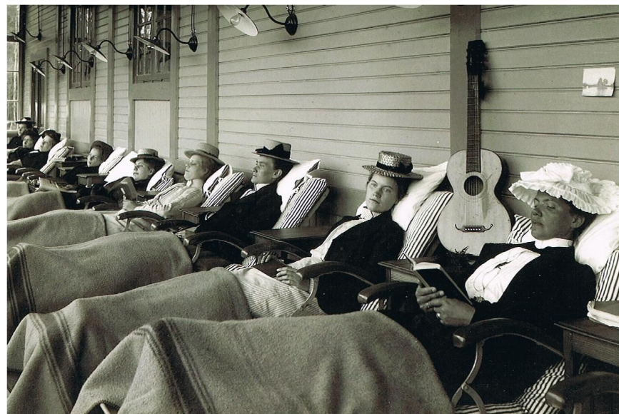
Foto med patienter liggande på liggverandan på Hålahults sanatorium.