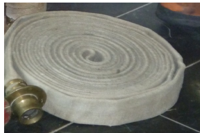
Gammal brandslang från Nerikes brandkår.