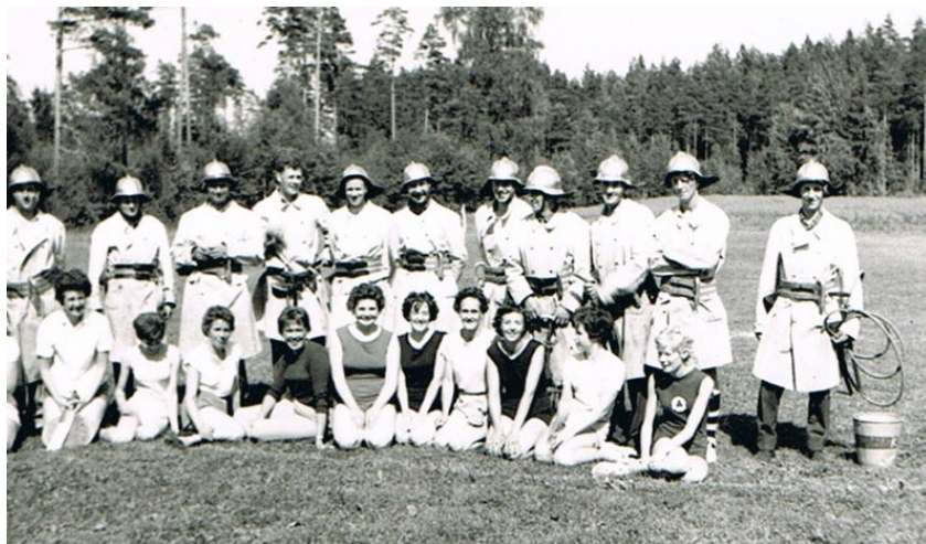
Fotot ovanför som någon i hembygdsföreningen skänkt visar uppställningen vid en fotbollsmatch mellan brandkåren i Kil och gymnastikflickorna någon gång mellan 1966—1969.