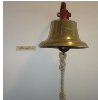
Den gamla brandklockan finns på Nerikes brandstation.