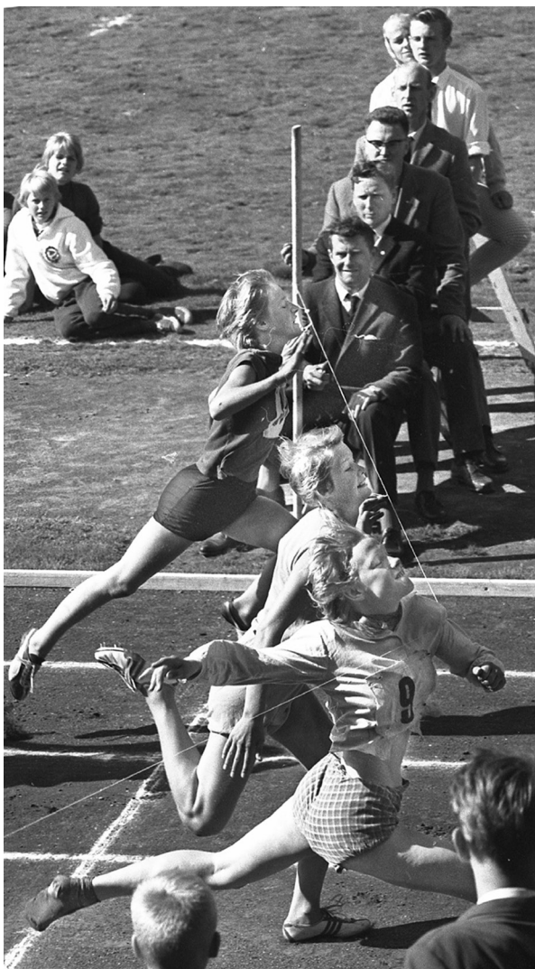
Dramatik vid tjejfinalen i lilla VM midsommaren 1961, där vinnaren spränger målnöret i strump-lästen.