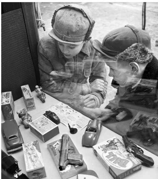
Många spännade leksaker på julsmylningen att skriva ner på önskelistan.