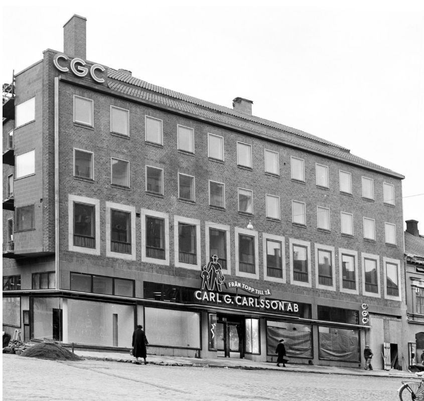
Den 28 november 1951, CGC är etablerade på nya adressen Drottninggatan 17 men är inte riktigt klara inför öppnandet. Vilka kläder man lockar med i skyltfönstren får man ännu inte veta.

CGC började som exklusivt varuhus och bytte senare inriktning mot exklusiva kläder på både herr- och damsidan. 1951 inrymde CGC landets största affärslokal i ett plan med en yta på 815 kvadratmeter. I slutet av 50-talet installerades Värmlands första rulltrappa, en nymodighet som folk kom långväga ifrån för att få uppleva enligt Värmlands