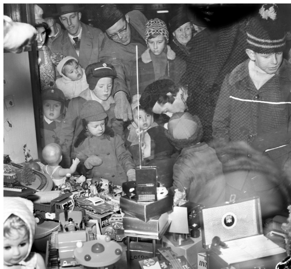
Skylltsöndagen drog som vanligt mycket folk, barnen flockades vid leksaksaffärernas lockelser.