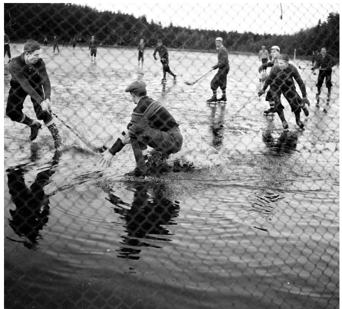
Klimatförändringar för 70 år sedan? När Göta och Färjestad möttes i december på Sandbäckstjärn var det blött, mycket blött.