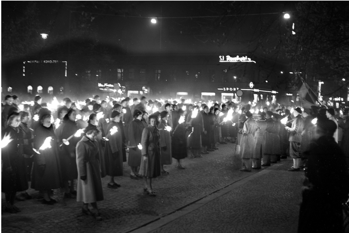
Fackeltåget till minne av Gustaf II Adolfs död 1632 avslutades på Stora torget utanför lärovetet.