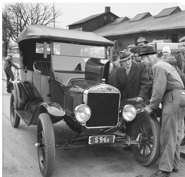
En välputsad T-ford från 1923 vid Bilinspektionen 2 december.