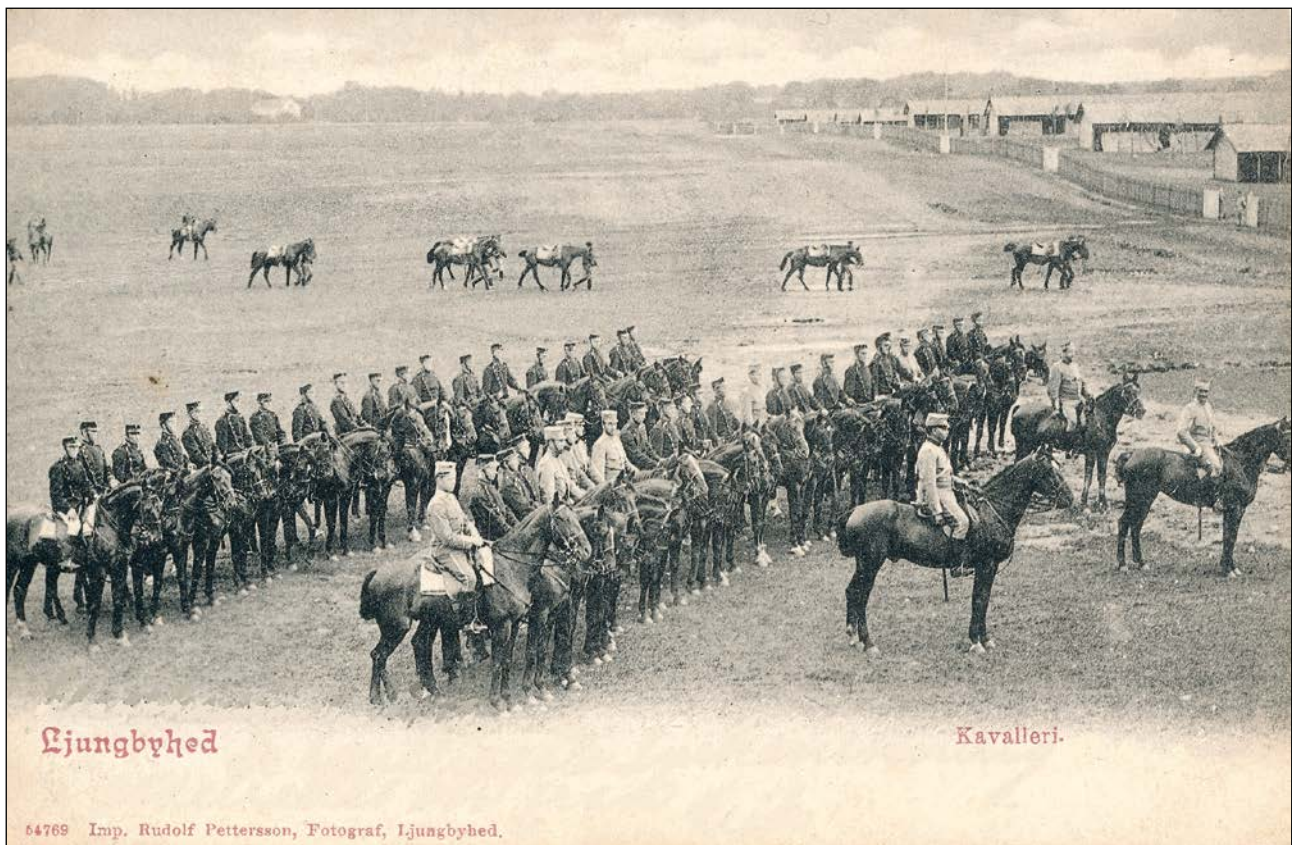
Vykort Skånska dragonregementet postat 1906.