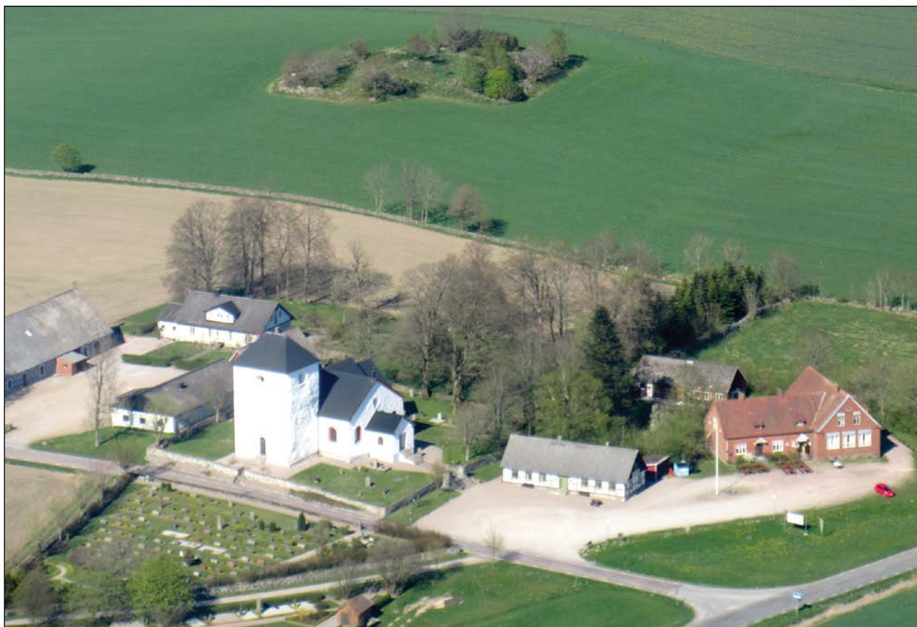
Östra Sallerup Ryttmästarbostället bakom kyrkan.

Södra skånska kavalleriregementet, slutligen benämnt Skånska Dragonregementet, förlades med början 1680 till Skånes södra och östra delar.