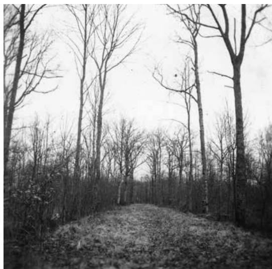
Perspektivgatan är inte bevuxen 1957 trots att inget skrivits om någon röjning där.

Det beslutas att kyrkorådet skall bekosta