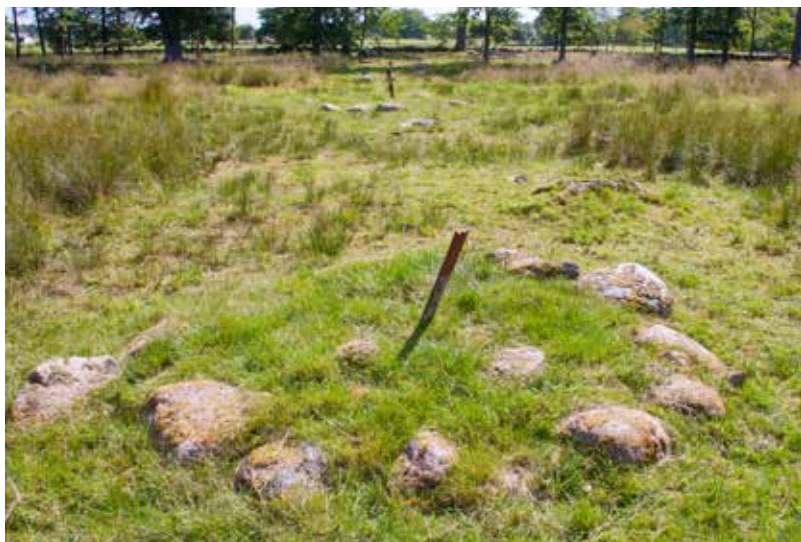
Kompassen 2017 med en stensättning i förgrunden och andra längre bort vid stolparna.