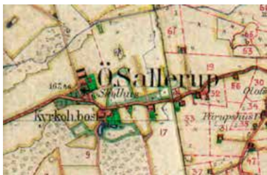
Häradsekonomiska kartan 1910-1915. Här har prästlönebostället kommit längst åt väster. Klockaren har flyttat sin gård och där har byggts ett skolhus, vilket långt senare kommer att bli församlingshem.