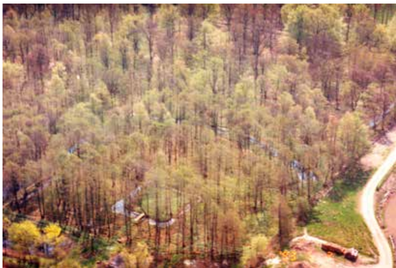
Flygfoto 1993 över nordvästra kvarteret där man ser kanalen runt den fyrkantiga ön i mitten.