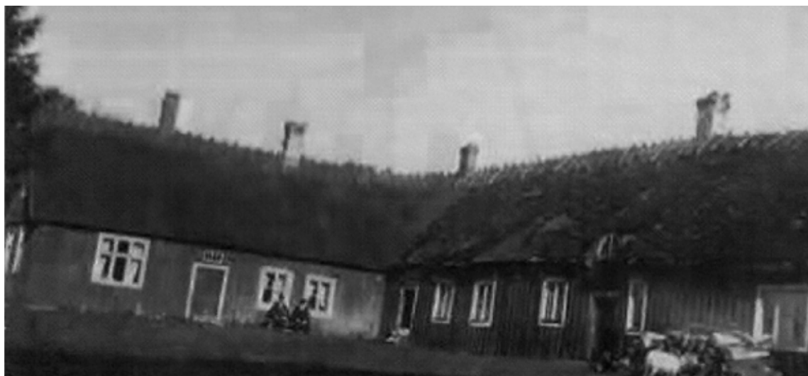
Prästgården ca 1921 innan en ny byggdes detta år. Denna byggdes efter att den förra brann 1792.