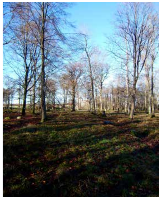
Efter avverkningen 2012 kan man se kyrkan i Perspektivgatans förlängning.

Intresset för 1600-talsgudstjänsterna avtar efter hand och 2002 äger den sista rum efter att ha arrangerats åtta år i rad. 2003 beslutar pastoratet