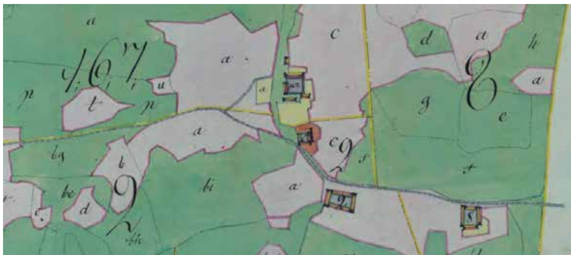
Karta daterad 1804 efter skiftet. Kyrkan ligger mellan de två övre gårdarna

visar också på att området har beskogats.