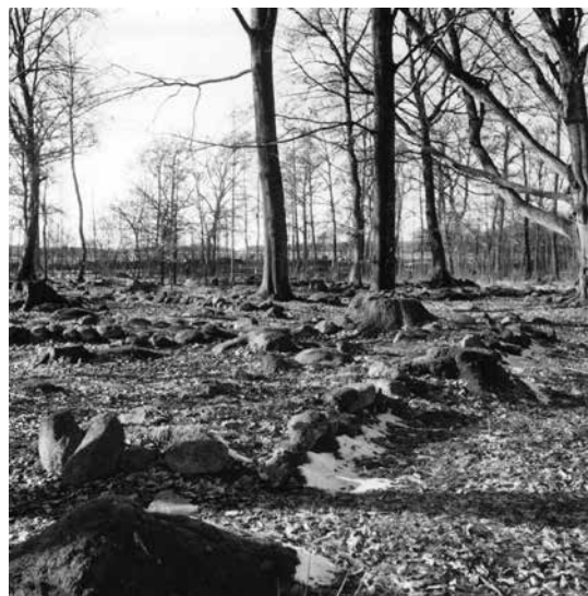
Kungahyllningen 1964.