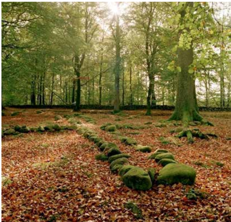
Bokstaven X i namnet Carolus XI, 2015.