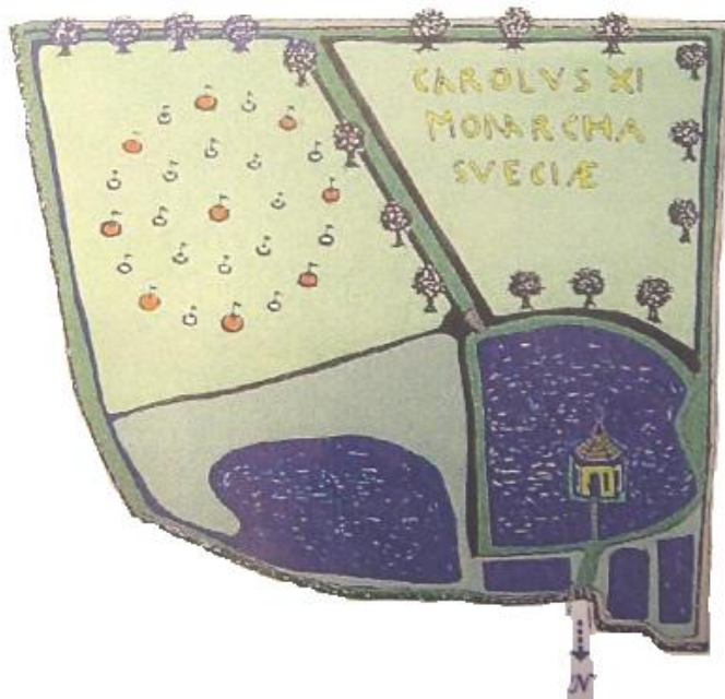
Fig.1. En rekonstruktion av parkens ursprungliga utseende. Teckning Katarina Frost 1996.

fyra kvarter. Mellan kvartererna finns vägar och kanaler. I parkens 2 norra kvarter återfinns dammanläggningar för fiskodling som sammanbinds av kanaler med in- och utlopp. I den nordvästra dammen ligger en kvadratisk ö, omgiven av ett knappt meterdjupt dike. På ön har det funnits ett lusthus.