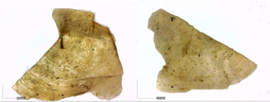
Fig 6. Fragment av fiskfjäll från karpfisk.

dammarnas tänkta funktion där diket skulle utgöra en uppsamlingsplats för dammens fiskar då det var skördetid.