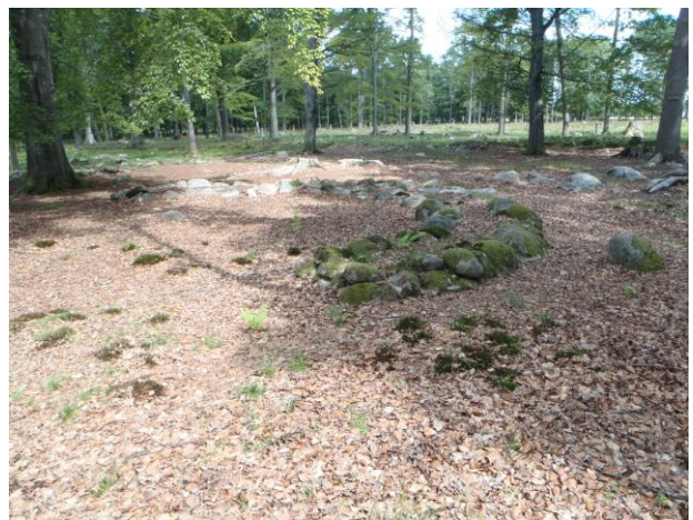
Fig. 2. C i CAROLVS från sydväst

Det sydöstra kvarteret består av 25 stensättningsliknande anläggningar, sannolikt planteringsbäddar, utlagda till en jättelik kompasskiva, ca 90 m i diameter.