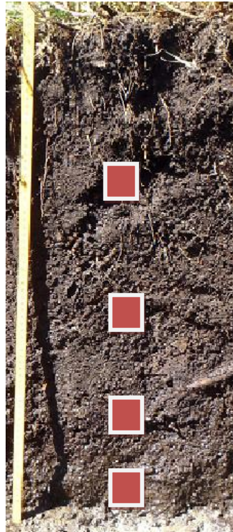
Fig 3. Sektion ur dike med provpunkter markerade, sektionen mäter 82 cm.

(Frost 1996). Eftersom det inte var klarlagt hur fort diket fyllts igen togs proverna på flera olika nivåer för att på så vis möjliggöra en studie av vegetationsförändringen över tid.