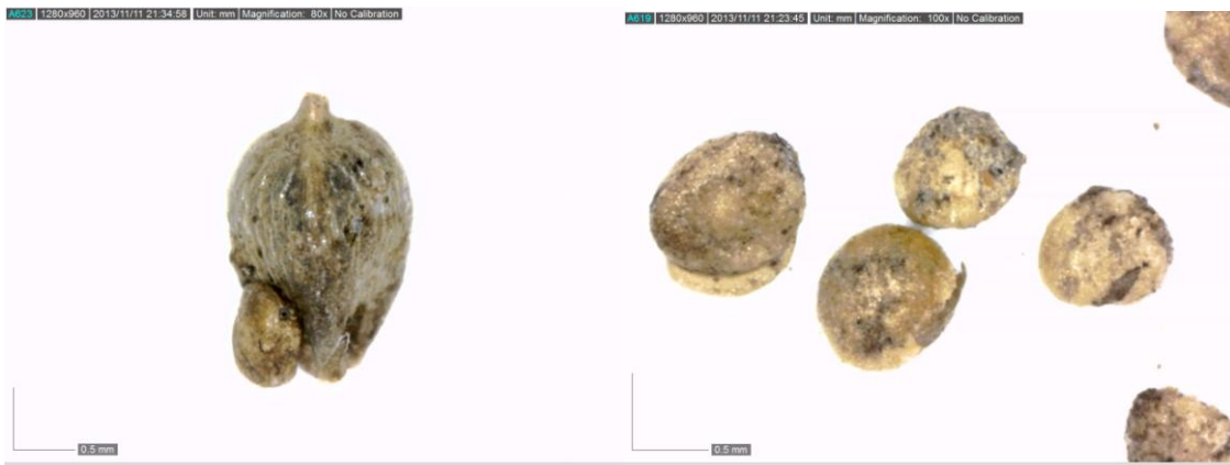
Fig. 4. Starrnöt och tiggarrunkel.

och gräs. Dessa arter ger oss inte någon information om vilka växter som planterats i parken men väl information om hur det såg ut kring diket vid tiden för dess igenläggande. Det är med andra ord en fuktig ängsmiljö där vattennivån varierade över året.