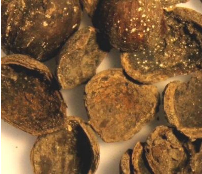
Fig. 5 Skal från hasselnötter.

I dessa bottenlager hittades även ett tiotal små fiskfjällsfragment som inte närmare kan bestämmas än till någon karpfisk. Fynden är intressanta med tanke på