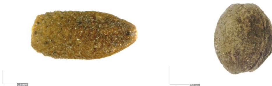
Fig. 7. Frö av fläder och kärna av trolig surkörnbär.